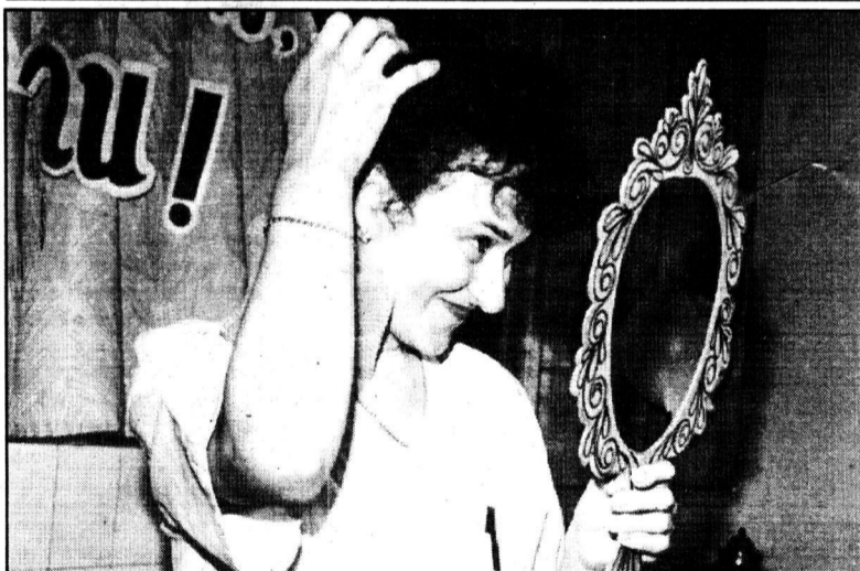
«Кто на свете всех милее?».