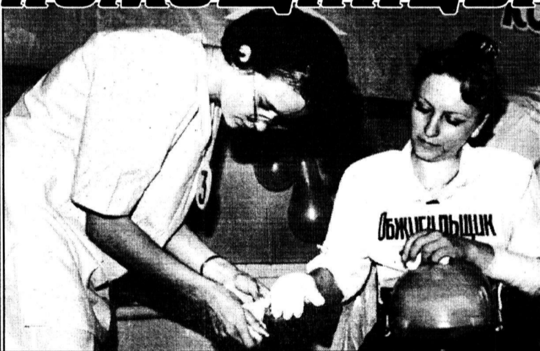
Срочно требуется перевязка.