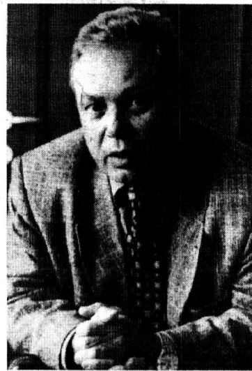
(Начало на 1 стр.)

— Это, вообще, не технический термин. Сама энергетическая система — промышленный узел. Как его разделить? Магнитогорск находится на стыке трех региональных систем — «Челябэнерго», «Башкирэнерго», «Оренбургэнерго». Через наши сети транзитом идет электроэнергия на юг Башкирии, на юг Челябинской области. Кроме этого, сам узел обеспечивает инфраструктуру и города, и сельские районы. Независимость — понятие условное. Под ним подразумеваем минимум потребления энергии из системы. Сегодня комбинат берет оттуда 50 мегаватт для себя и