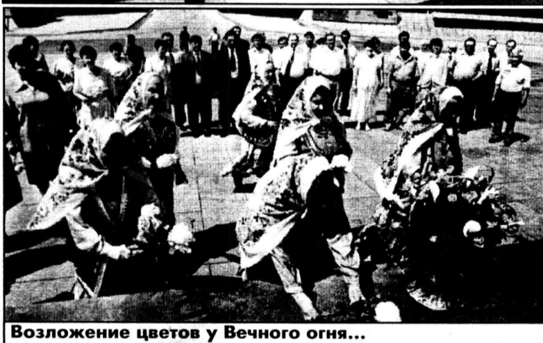
Возложение цветов у Вечного огня...

усилиями вопросов совместного использования территории курортной зоны, что предусмотрено октябрьским 1998 года Соглашением № 214, подписанным между Челябинской областью и Республикой Башкортостан. Обсудив предложенный проект положения о Курортном совете, стороны договорились все спорные вопросы по возобновлению деятельности этого общественного органа решать в ходе рабочих встреч специалистов заинтересованных сторон.