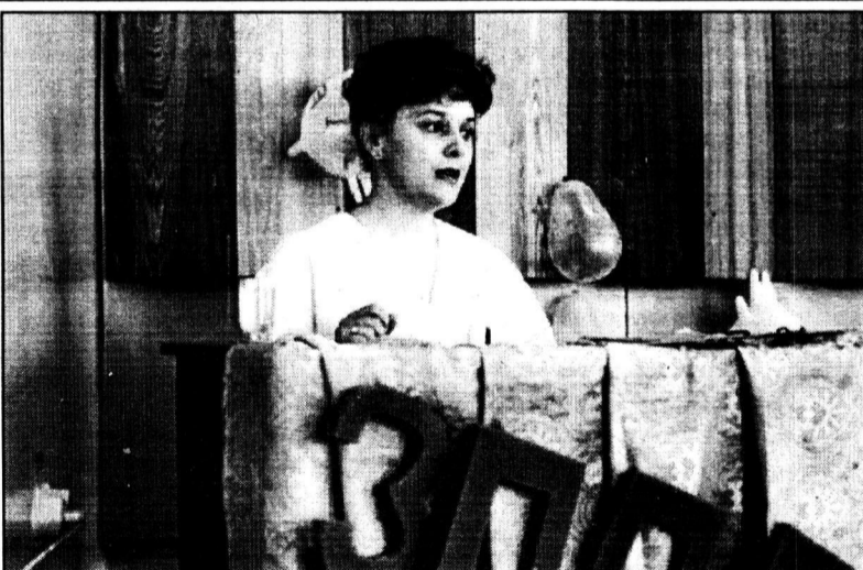
Внимание: на трибуне — медик.

Именно к ним, фельдшерам здравпунктов, мы обращаемся со своей болью. Именно они спешат на помощь, чтобы оказать страждущему первую помощь. Именно в беседе с ними мы получаем обилие информации о том, как сберечь свое здоровье... И в любой ситуации они готовы быстро и качественно выполнить свою работу. В этом еще раз убедил прошедший на днях конкурс представителей медицинских пунктов комбината, которые боролись за почетное звание «Лучший фельдшер здравпункта-2000». Поздравлен он был 70-летием здравпунктов ММК.