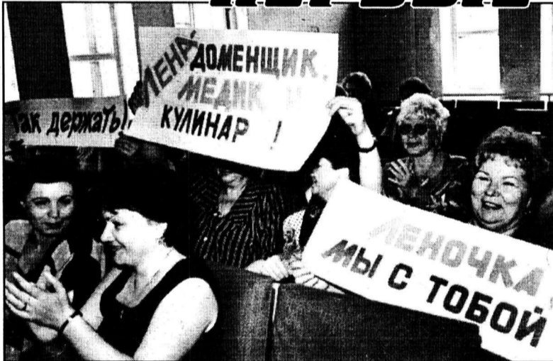
«Так держать!» — скандируют зрители.