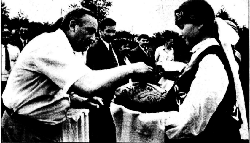
Встреча делегации Абзелиловского района на магнитогорской земле.