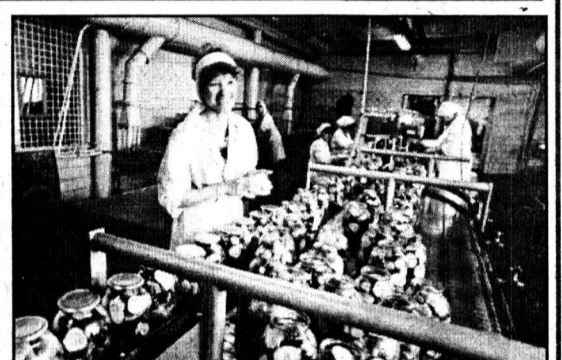
Переработка овощной продукции.

Нам, людям, воспитанным при советской системе, проповедовавшей социальное равенство, трудно было воспринимать эту сложившуюся ситуацию, порожденную рыночной экономикой. Но разве и прежде не было товарных баз для избранных, особо-