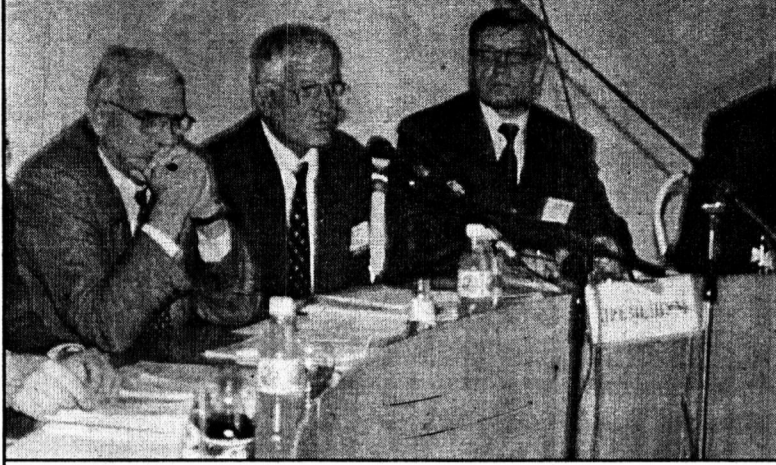
В президиуме пленума.