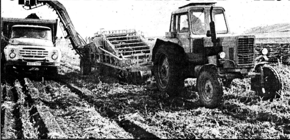
Идет уборка картофеля.