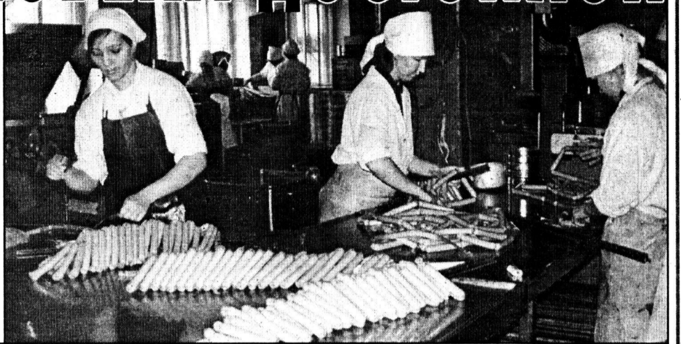
Колбасные изделия с маркой ММК.