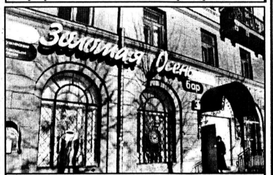
К услугам горожан бар.

го ассортимента продуктов для покупателей «с заднего крыльца»? Декларации оставались декларациями, а жизнь складывалась независимо от них.