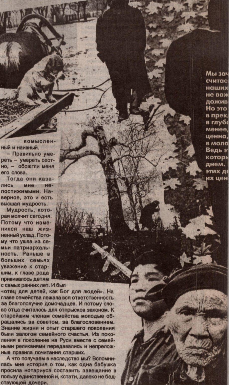
комысленный и наивный.

Мы зачастую цинично считаем, что жизнь наших стариков не важна, что они просто до-