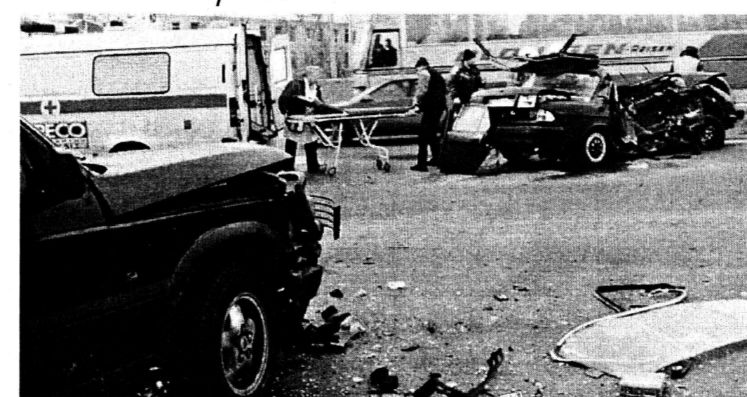
Закон об ОСАГО дает ответ на главный вопрос: кто будет восстанавливать разбитый в аварии автомобиль

Каждый владелец авто до 1 января 2004 года обязан получить полис. С этого времени наступает административная ответственность, предполагающая наложение штрафа от 500 до 800 рублей. Но и здесь пока многие вопросы остаются неурегулированными. Например, кто будет проверять наличие полиса у автовладельца. Полагаю, что эту функцию станут выполнять органы ГИБДД. Для этого Кодекс об административно-правовых нарушениях будет предусматривать санкции за эксплуатацию незастрахованного автомобиля. После 1 июля 2003 года наличие полиса станут контролировать при прохождении техосмотра. А с 1 января 2004 года его, по всей видимости, должны будут предъявлять представителю ГИБДД при каждой проверке документов.