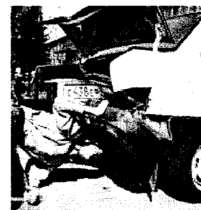
Кто заплатит за деформацию?