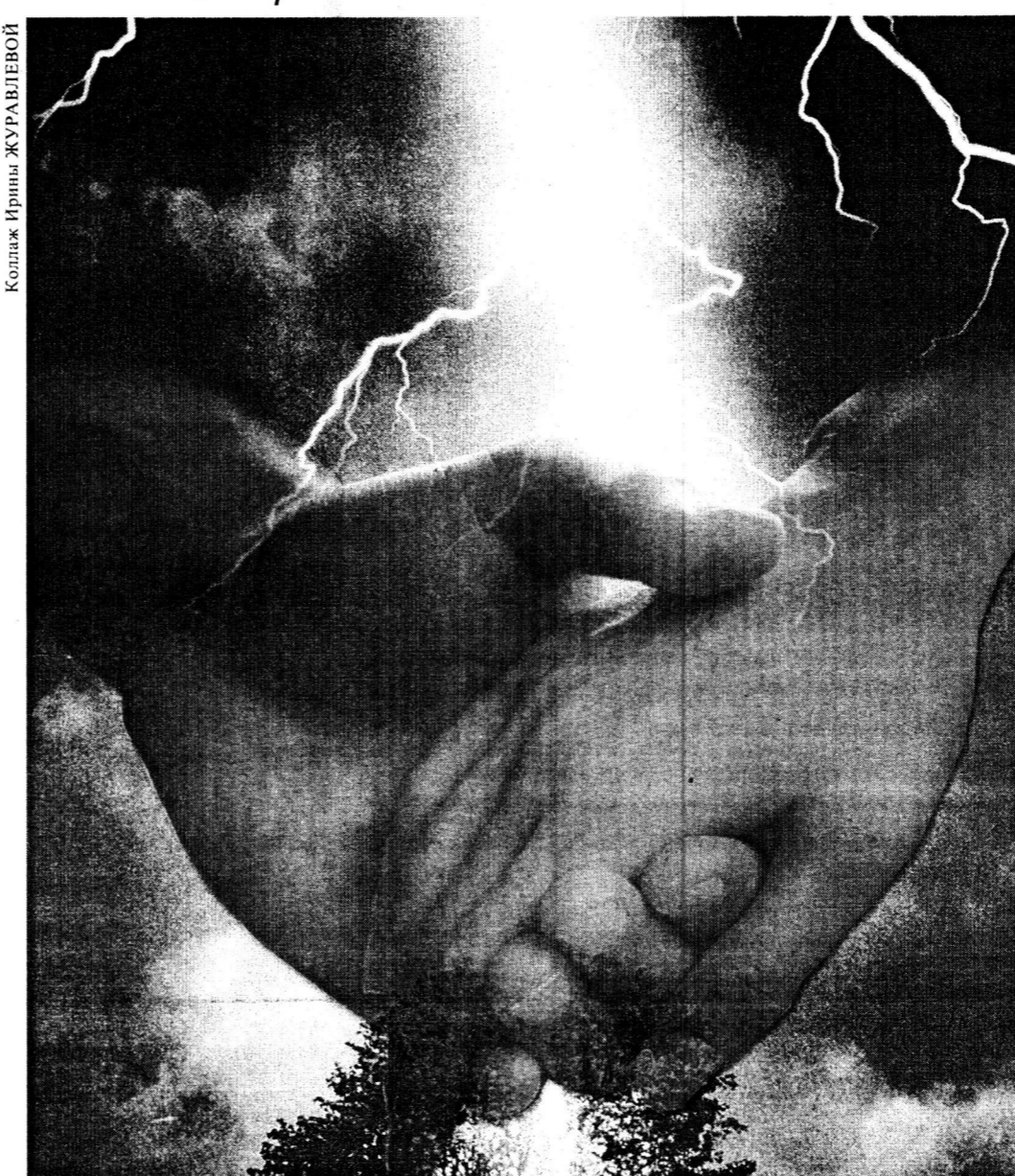
Коллаж Ирина ЖУРАВЛЕВОЙ

Что и говорить, жизнь сейчас не сахар. Параллельно с обнищанием основной массы народа активно насаждается общество потребителей, из повеленности вытесняется высокий смысл доброты. Носителями доброты остаются старики и те, кто сам хлебнул невзгод под самую завязку, выкарабкался при поддержке людей. Да и наше родное государство не на стороне тех, кто по зову сердца готов делать добро. Взять хотя бы истории с отменой