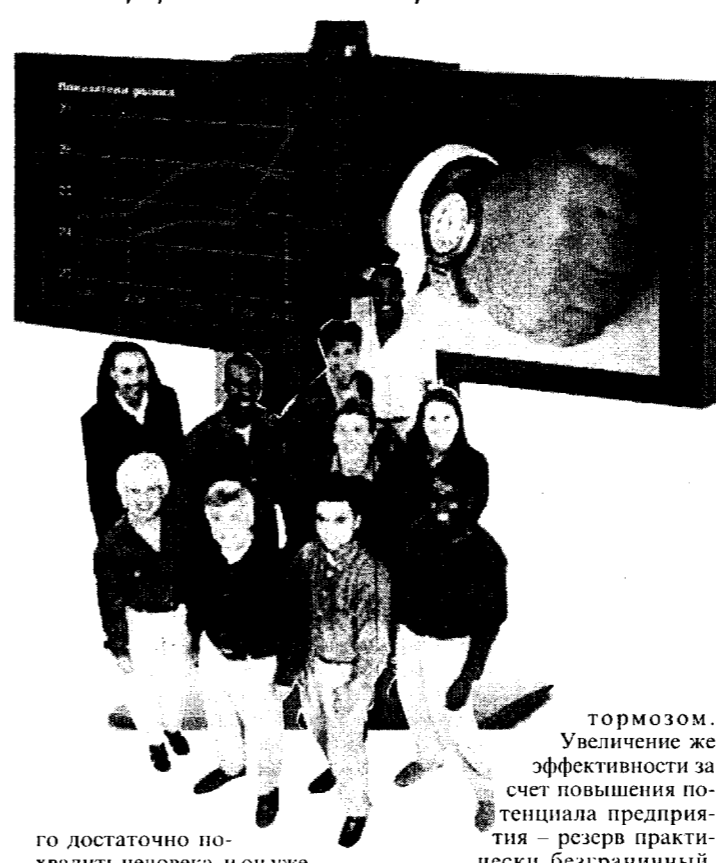
По мере демократизации общества нам придется очень скоро обратиться к действительно эффективным методам совершенствования «управления», а не совершенствования «правления».