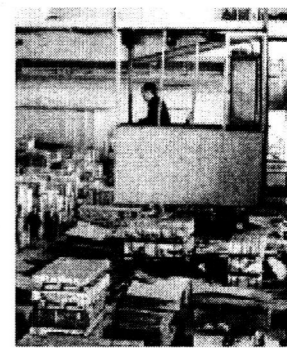
На сырьевом рынке металлургии

Выходит с 5 мая 1935 года Цена договорная № 35 (11073) 27 марта 2003 года ЧЕТВЕРГ