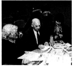
Ветеранов беспокойное племя