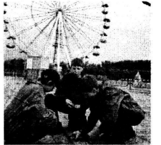
Аттракционы на задворках