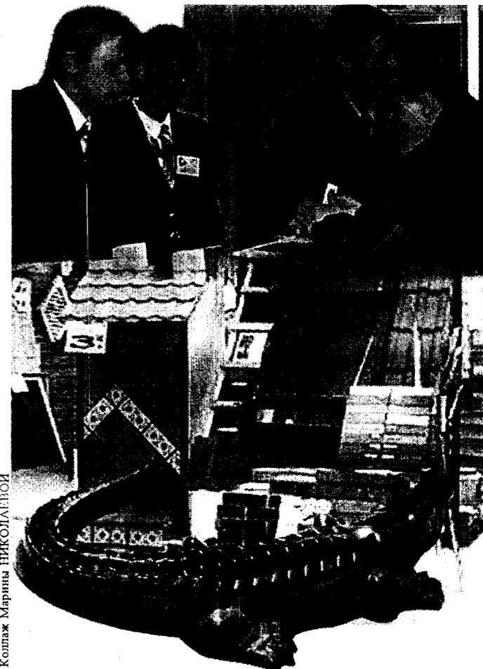
Коллегия Мартина НИКОЛАЕВ

Многослойность - это веяние времени. Многослойные стены, полы. Один слой несущий, другой утепляющий, третий украшающий.