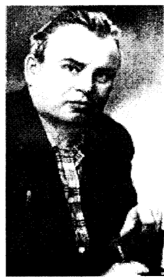
прочие соучастники контр. рев. банды были такими искусными конспираторами, что проводя подвальною работу, не оставляли никаких явных свидетельств...

того, чтобы объяснить последнее, я должен вернуться к прошлому и рассказать о своих переживаниях в осень 1937 года и об обстоятельствах моего ареста и следствия.