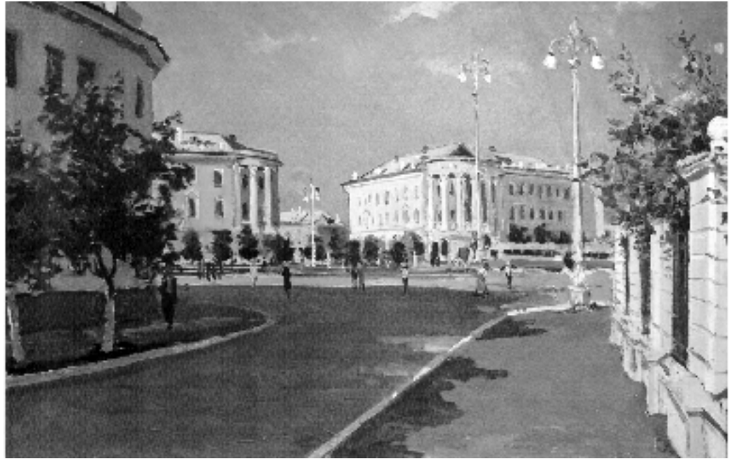
«Вид на площадь им. Горького». 1958 г.

Работы эти, без преувеличения, составляют развернутую живописную летопись Магнитки и ее металлургического гиганта. Промышленные пейзажи, запечатлевшие цеха комбината 50–70-х годов прошлого столетия, портреты передовиков производства и исторических директоров Магнитки соседствуют на страницах издания, выпущенного при поддержке руководства ОАО «ММК», с лиричными картинами уральской природы, полотнами, написанными на исторические сюжеты, лица-