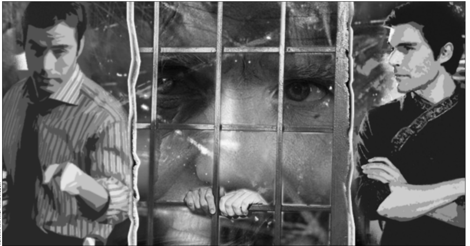
КОЛАЖ МАРИНЫ НИКОЛАЕВОЙ

Прикатила тройка в больницу, вызвали Радика, и тот честно признался, что в день гибели Дениса был на работе. О смерти Иванова-младшего знает лишь со слов друзей-наркоманов. Один из них, по кличке Грач, все время оклачивается «на квартале», и Радик готов поговорить с ним. Компания правдоискателей направилась на улицу Жукова. Грача не нашли, и Хазанов предложил поискать в лесопосадке, у родничка, в излюбленном месте сбора «квартальских» наркоманов. Прикатили в лесопосадку, отыскали родничок — ни души. С этого момента показания обвиняемых опять резко расходятся. Иванов утверждает, что Радик вдруг заволновался, попытался выйти из машины. Сидевший рядом Антон заблокировал двери, чем и спровоцировал Радика на ругань. Он стал размахивать руками и саданул локтем Иванова. «Чтобы прекратить удары с его стороны, я достал из кармана нож и ткнул в область живота Хазанова», — говорил на следствии Иванов. Радик выхватил у него нож и полоснул им по лицу обидчика. Пытаясь остановить хлынувшую кровь, Иванов зажал рану курткой и не видел, кто и сколько ударов нанес потерпевшему. Однако тот момент, когда парни потащили избитого Радика в лесополосу — все же заметил. Вернулись они минуты через две. На вопрос, где Хазанов, Антон ответил: «Конец!»