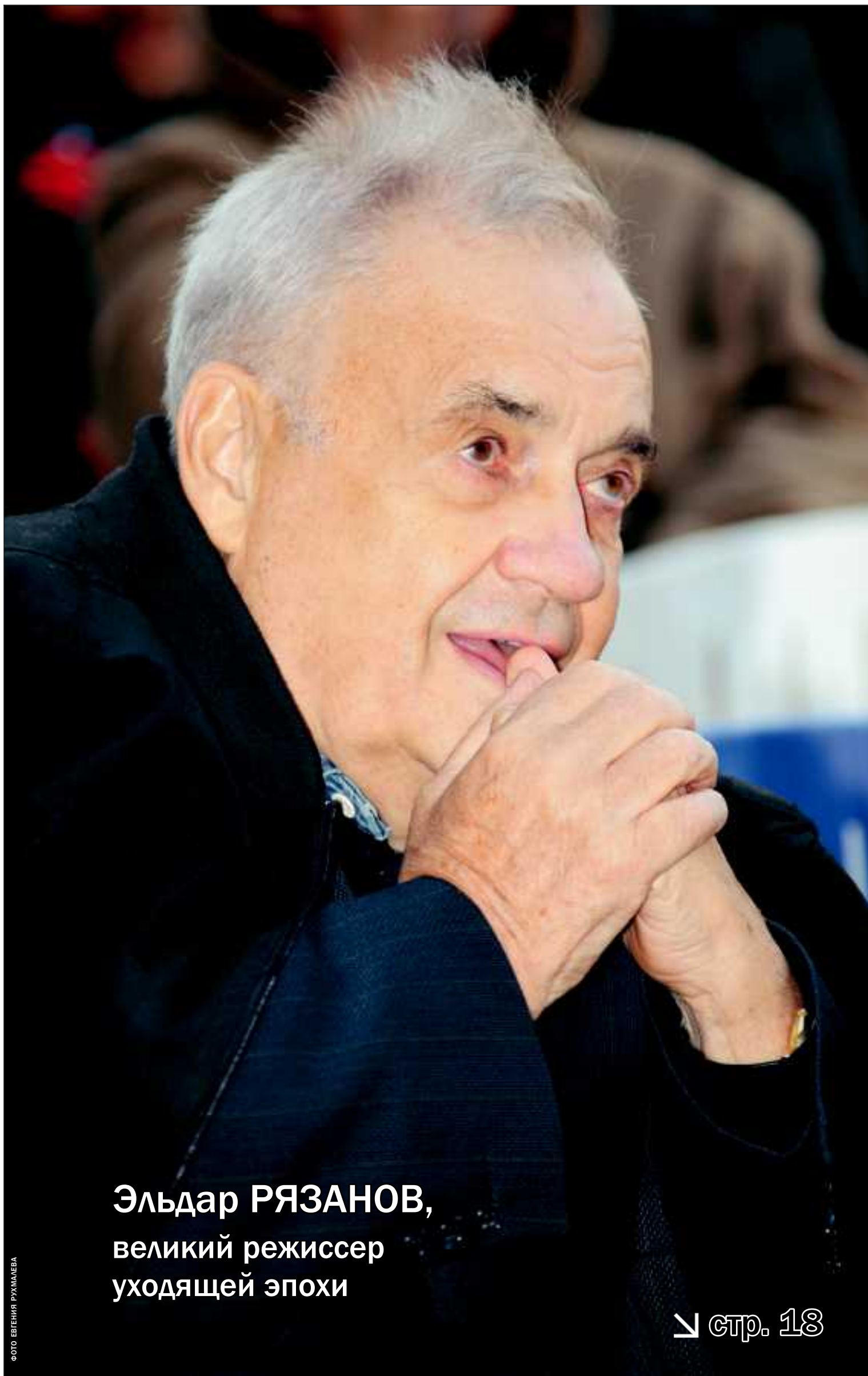
Эльдар РЯЗАНОВ, великий режиссер уходящей эпохи