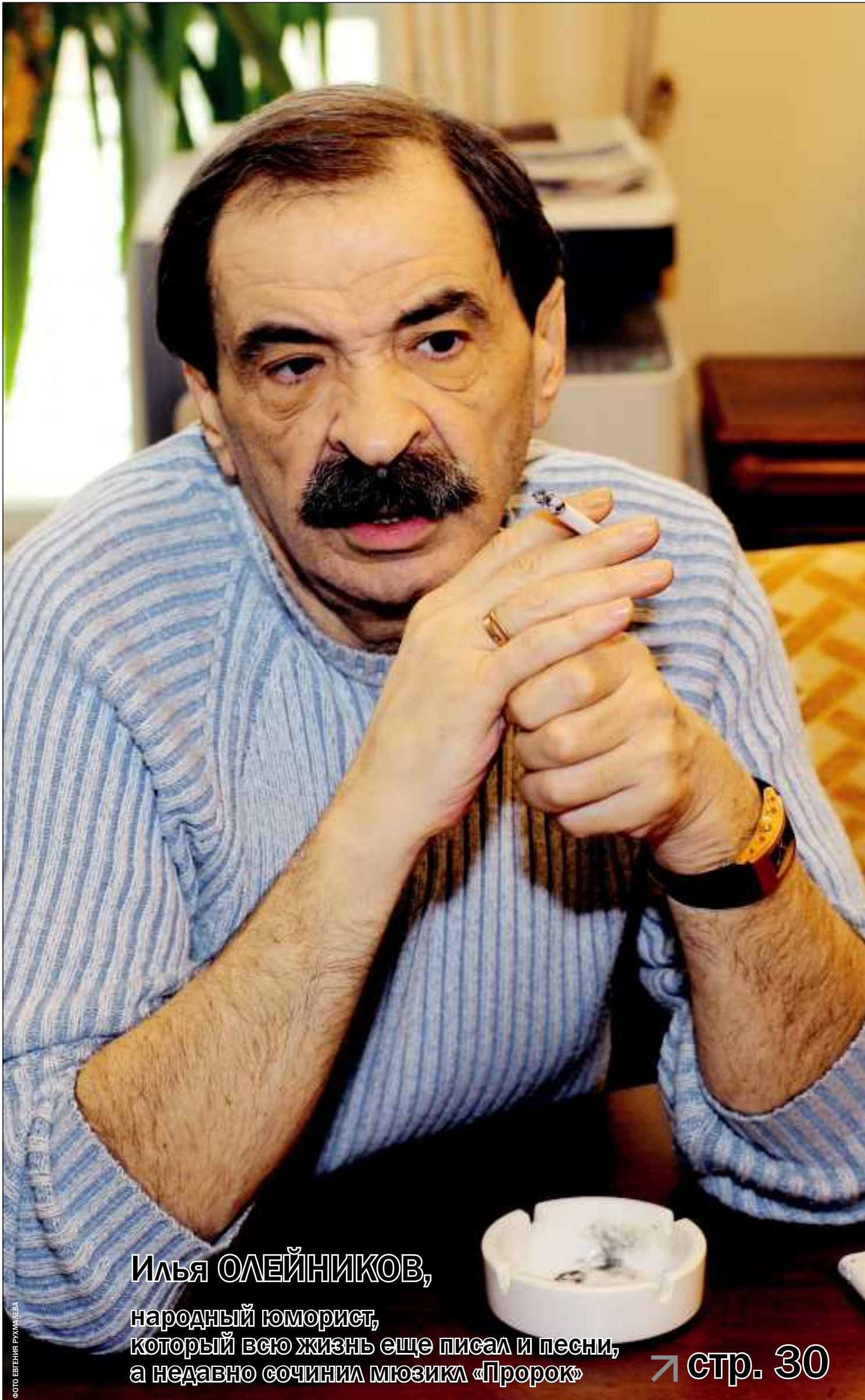
Илья ОЛЕЙНИКОВ, народный юморист, который всю жизнь еще писал и песни, а недавно сочинил мюзикл «Пророк»