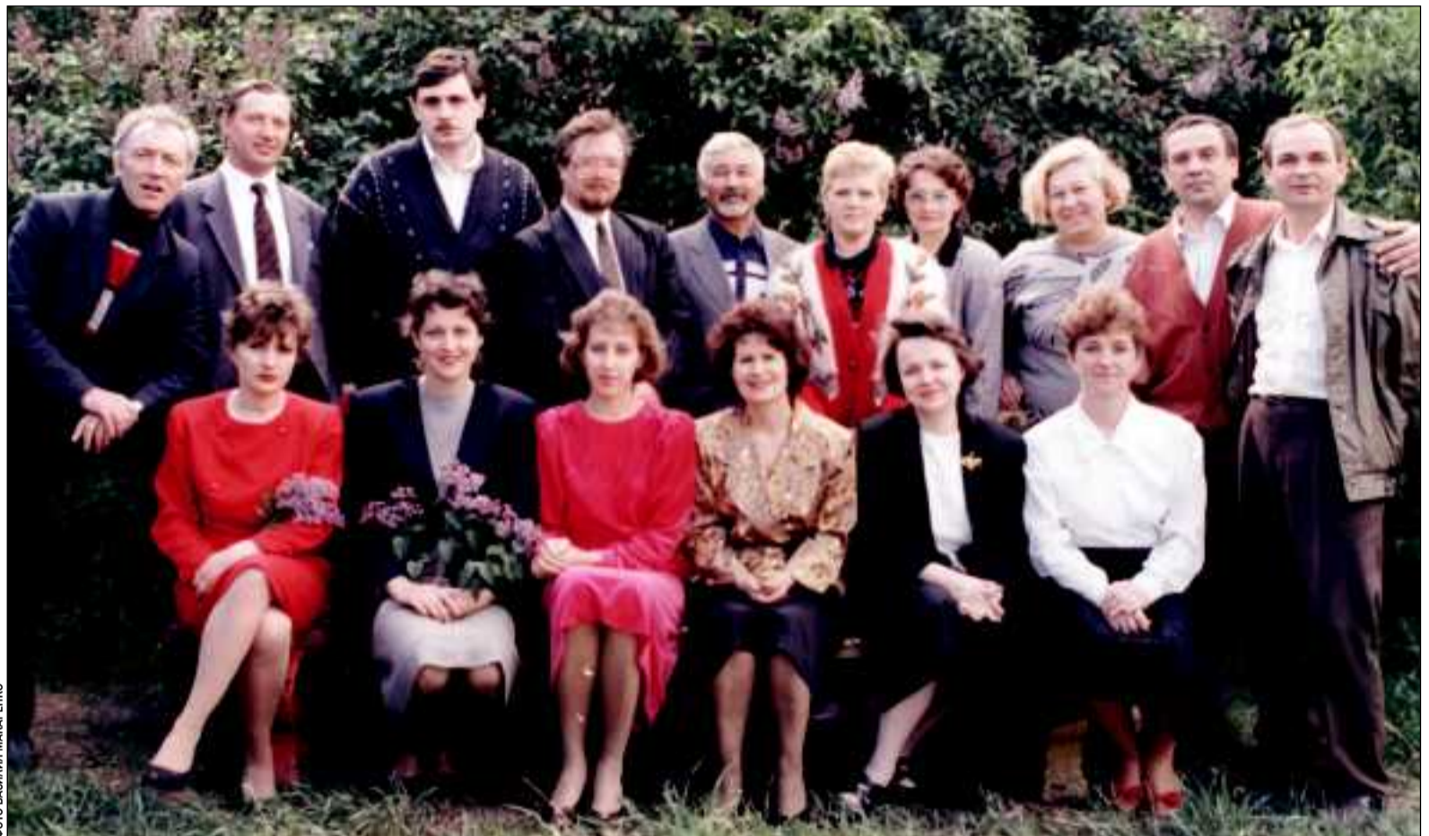
Май 1995-го. Цветет сирень... Редакция «ММ» тогда находилась в бывшей гостинице «Азия»