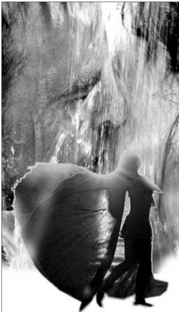
КОЛЛАЖ ИРИНЫ ЖУРАВЛЕВОЙ

Начались танцы. Лиза, как всегда, двигалась самозабвенно, полностью подчиняясь своему телу, доверяя ему и получая максимум удовольствия от любых его желаний. Мельком взглянув на тех, кто пока не спешил присоединиться к танцующим, она сразу заметила этого молодого мужчину, его уже знакомый взгляд и почти мимоходом отметила, что разница в возрасте у них, пожалуй, лет в десять. «Мальчишка!» – усмехнулась Лиза. Но ее тело вдруг начало двигаться в совершенно ином ритме: не спросив ее, оно уже буквально завлекло этого человека. Объявили медленный танец. Лиза поспешила из зала. Во-первых, решила передохнуть. Во-вторых, ее всегда угнетает сам факт ожидания: пригласит на танец или нет? «Стой и жди... Не хочу!» – протестовала внутри себя Лизавета. – Я сама решаю, когда, где, с кем и сколько хочу танцевать». Однако уйти далеко от площадки ей не позволили. Сделав несколько шагов, она услышала за спиной негромкое, почти робкое: «Потанцуйте со мной! Пожалуйста...» Оглянулась и, чуть смутившись, бук-