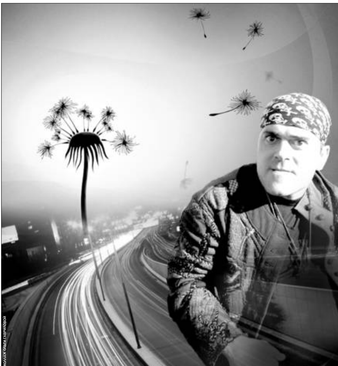
КОллаж Ольги Гавриловой