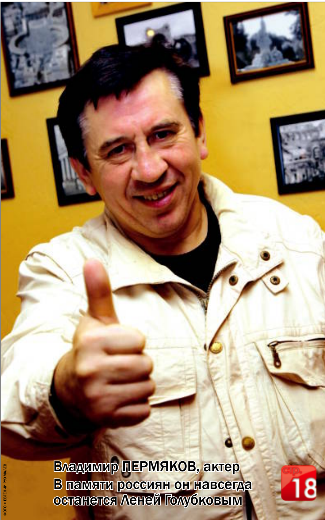
Владимир ПЕРМЯКОВ, актер В памяти россиян он навсегда останется Леной Голубковым