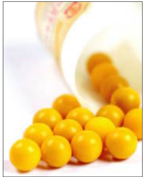
Многодетных семей работников ОАО «ММК». Выдача препаратов организована на базе цеховых здравпунктов дважды в год – осенью и весной ©

По решению руководства комбината второй год в рамках социальной программы поливитаминными обеспечивают ребятшек из