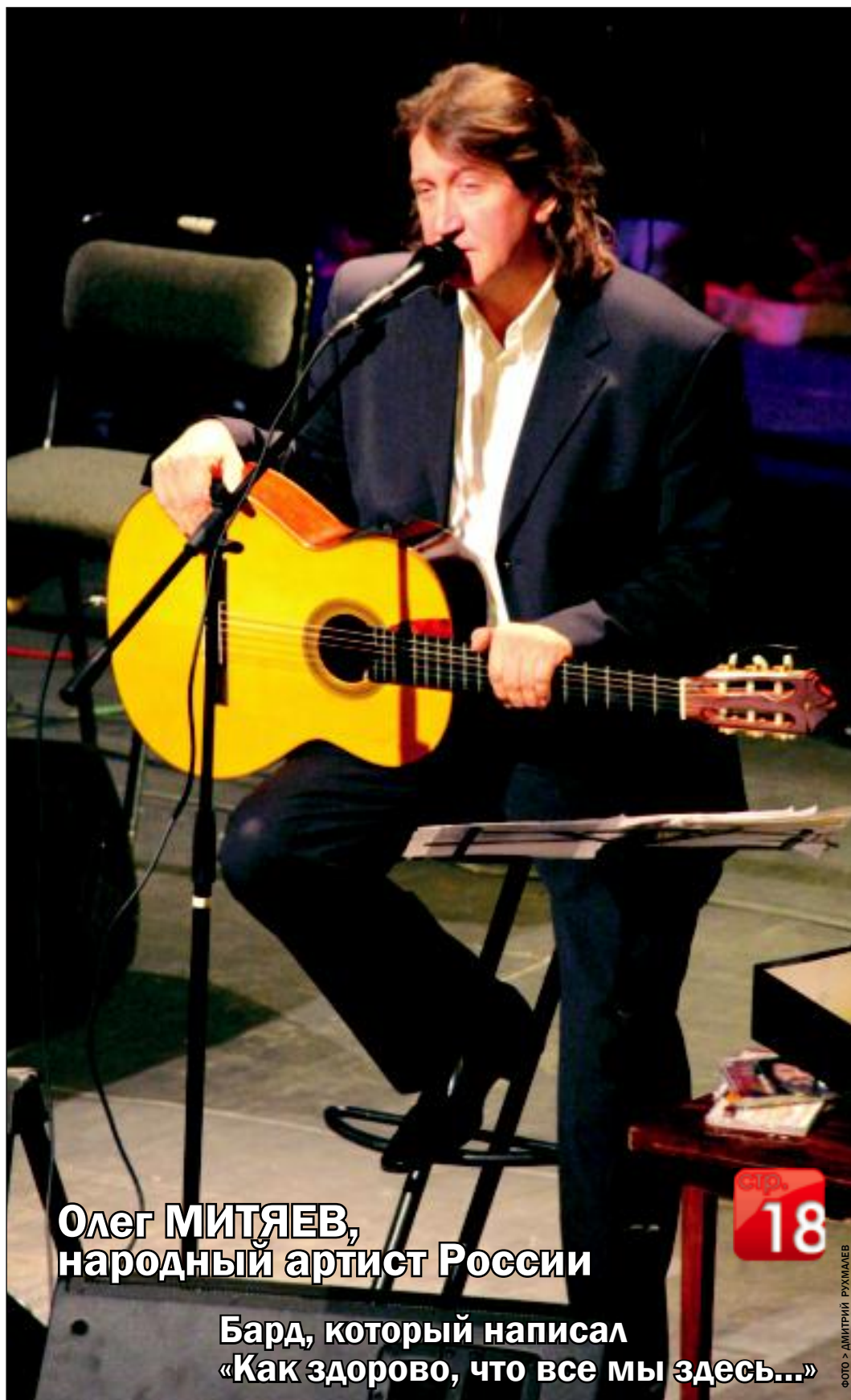
Олег МИТЯЕВ, народный артист России

Бард, который написал «Как здорово, что все мы здесь...»