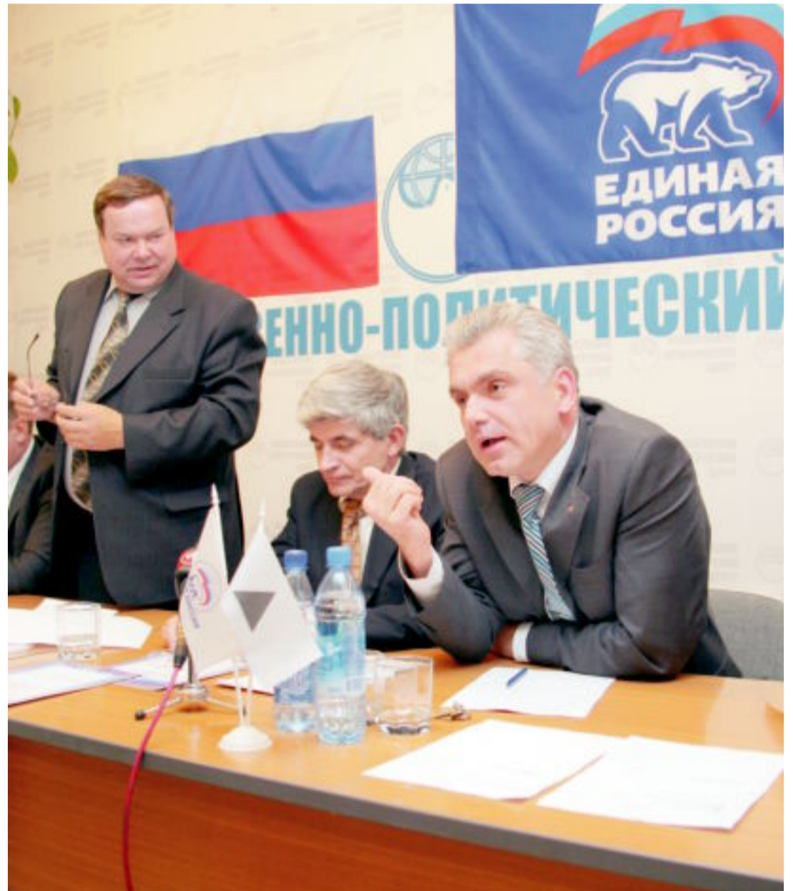
Пятого августа магнитогорские «единороссы» будут принимать участников выездного заседания президиума регионального политсовета «ЕР»

В сентябре предвыборную программу опубликуют в средствах массовой информации.