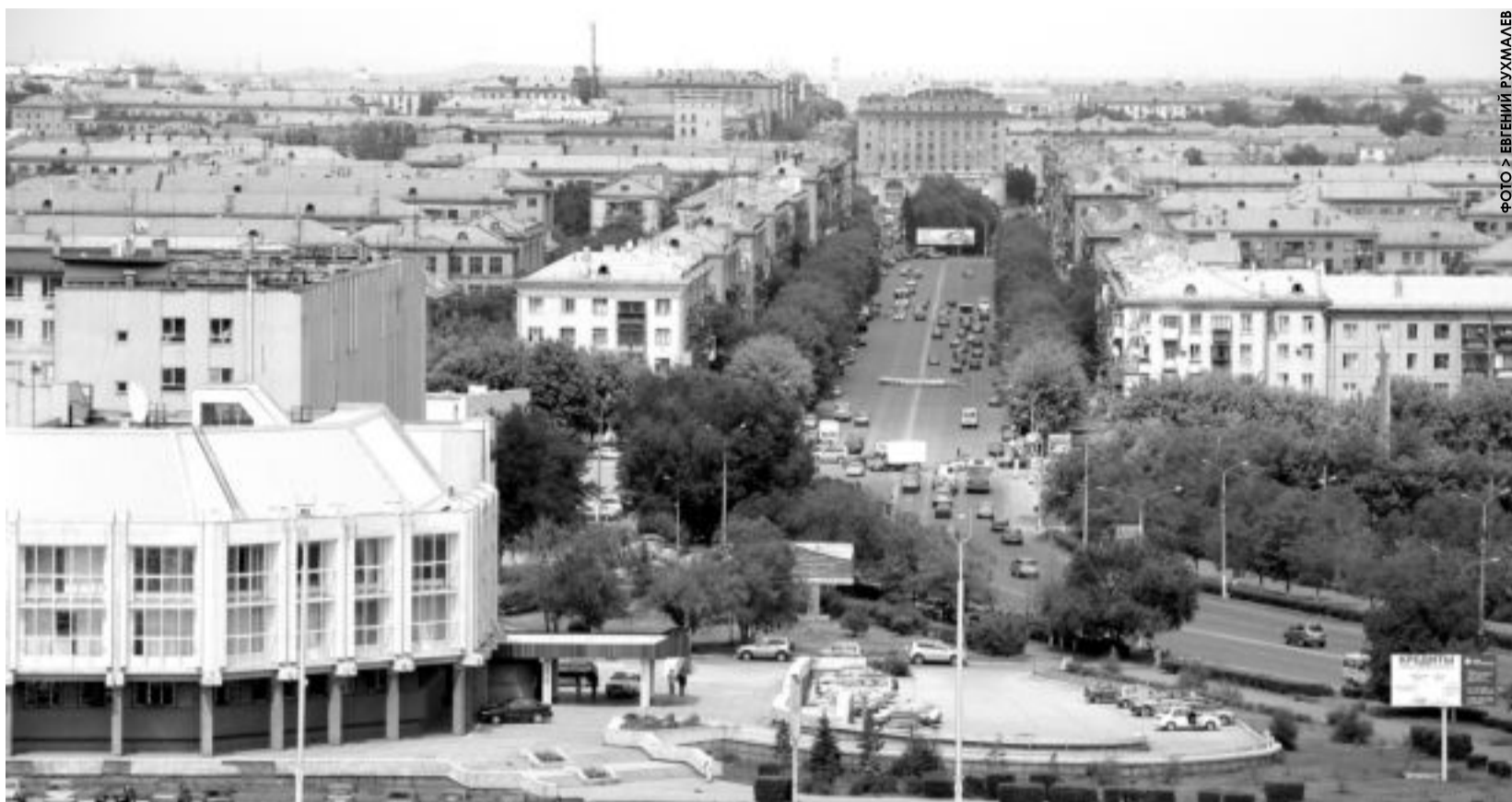
ФОТО: ВНЕШНИЙ РУКАВ

На вопросы, прозвучавшие на встрече с профгруппами ОАО «ММК», отвечает городская администрация