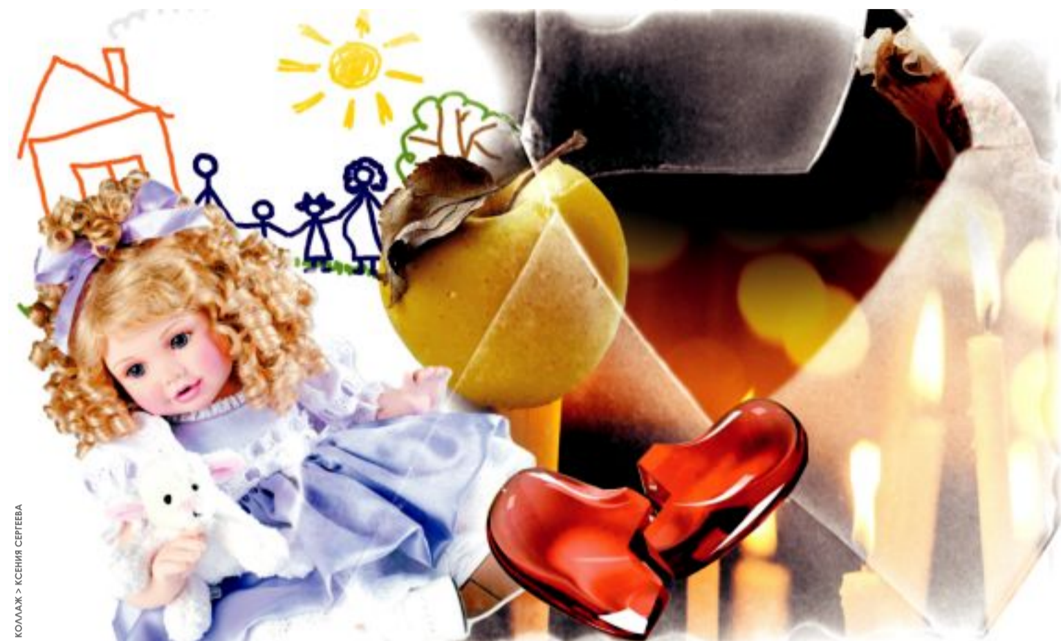
КОМАК > КСЕНИЯ СЕРГЕЕВА

Свидание бабушки и внуки обеспечивают приставы трех районных служб