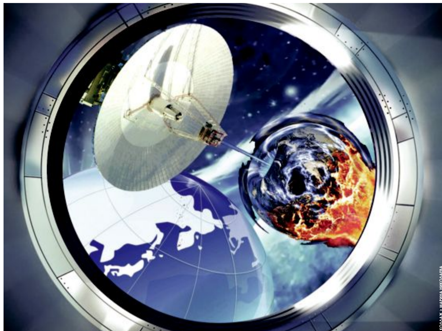
КОЛМАЖ > МАРИНА НИКОЛАЕВА

В космическое пространство выведен новый американский беспилотный корабль. Миссия X-37В строго засекречена