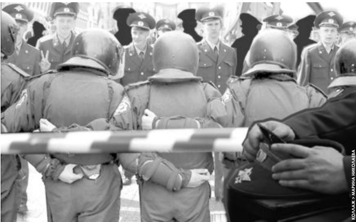
КОЛЛАЖ > МАРИНА НИКОЛЦЕВА

➤ «Палочная» система учета осталась неколебима