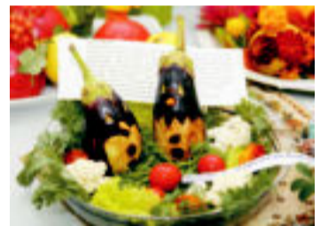
ФОТО &gt; ДМИТРИЙ РУХМАЛЕВ

– Большое спасибо, что вы с нами, – обратилась к присутствующим Марина Шеметова. – Приятно видеть ваши просветленные лица, надеемся, что пребывание в нашем центре укрепит силы и здоровье, добавит настроения, и вы еще долго будете учить деток и внуков, передавать им свои таланты ☺