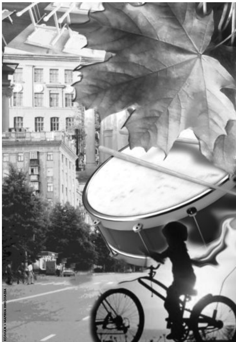
КОЛЛАЖ > МАРИНА НИКОЛАЕВА

Еще в окно школы с юго-восточной стороны между бассейном и легкоатлетическим манежем можно увидеть два поля. Одно для футбола, другое – под каток. Зимой оба заливали водой, и полгорода, если стояла хорошая погода, приходили туда изображать из себя хоккеистов, фигуристов и прочих спортсменов зимнего плана. Не отставал тут и я. Это было сущее мучение! Я не ходил на каток в валенках – боялся, что их своруют. А в раздевалке принципиально оставлять их не хотел, потому что за это брали деньги. И поэтому отулицы Жданова – ныне Ленинградской – перся до катка на коньках. Туда – еще ладно... Но обратно! Когда ноги устали и уже не держат и лезвия коньков в разные стороны – только не прямо. Когда не идешь, а еле передвигаешься, ползешь на вывороченных набок ступнях – от забора до забора, за который можно только подержаться, не более... И топай дальше – останавливаться нельзя, ибо ноги немеют с каждой минутой все больше. Добраться до дома в таком состоянии – равнозначно маленькому подвигу. Но это не все... Замерзшие, натруженные ноги в теплой квартире тут же начинали напоминать о себе: надо скорее скидывать обувь, носки и толкать красные, стильные ступни под холодную струю