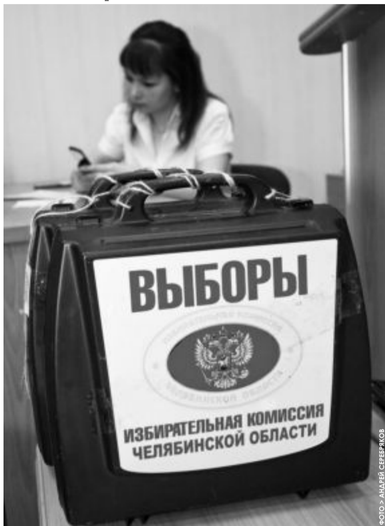
ФОТО &gt; АНАТОЛИЙ СЕРЕБРЯКОВ

В ЭТОМ ГОДУ день трех десятков (10 октября) станет судьбоносным не только для молодых (любимые записываются в очередь, чтобы зарегистрироваться именно в этот день), но и для будущих депутатов Законодательного собрания. Во второе воскресенье месяца нас, избирателей, приглашают на голосование.