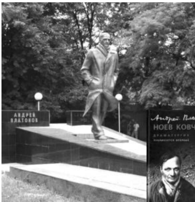
Андрей Платонов был занесен в список нежелательных авторов