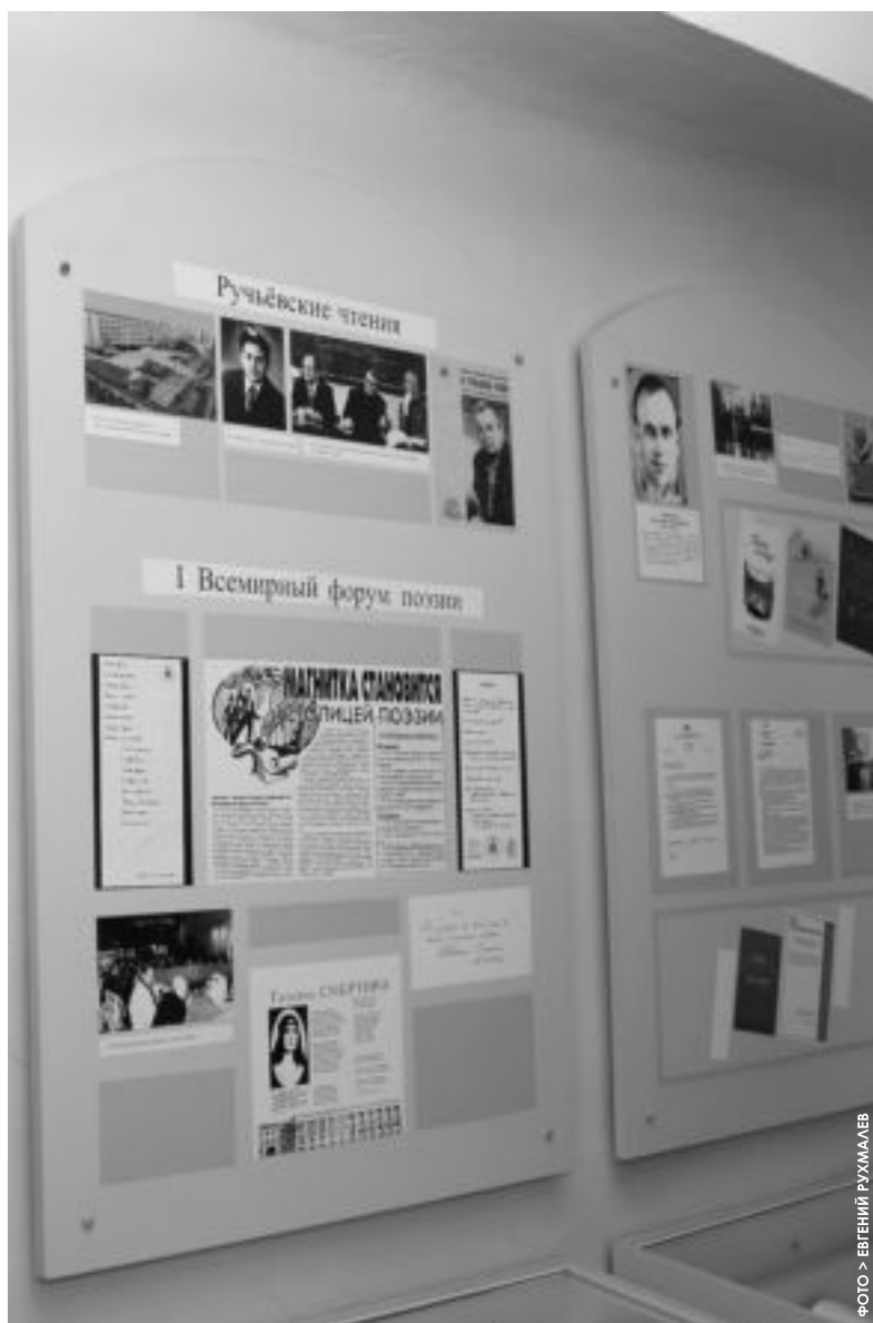
Одна из экспозиций музея Бориса Ручьева