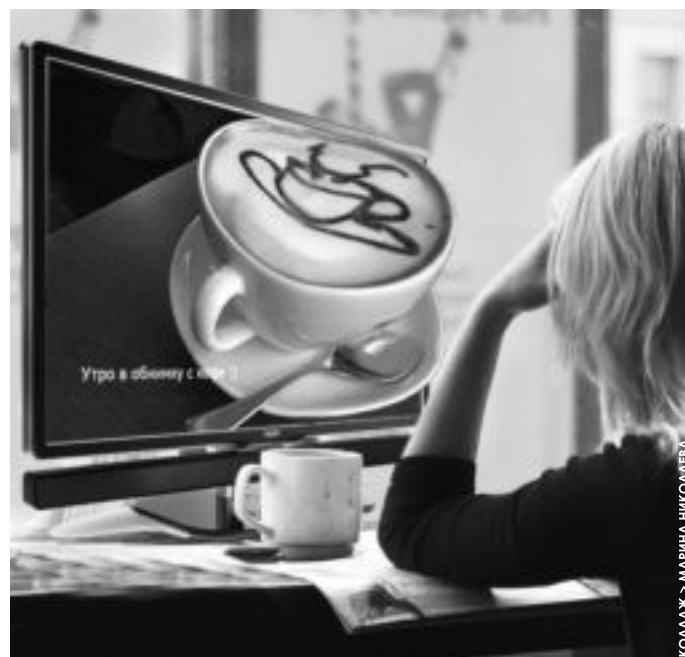
КОЛЛАЖ &gt; МАРИНА НИКОЛАЕВА

Телевизоры с опцией 3D позволяют смотреть фильмы на цифровых носителях в трехмерном формате, а также способны переводить в объемный формат передачи, например, трансляции спортивных матчей. «Смотрите выпуск новостей и ощущаете себя в центре событий, – заверил