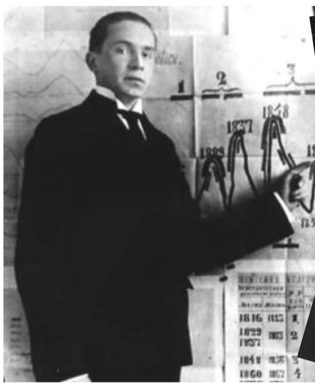
Александра Чижевского иногда называли Леонардо да Винчи XX века