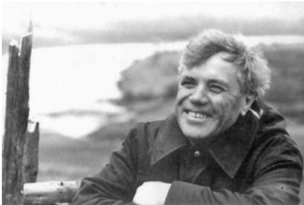
Виктор Астафьев – классик советской литературы

Раньше, наезжая из Перми в Москву, Виктор Астафьев заруливал ко мне в Калугу. То, что я попал в нети и нахожусь под слезкой, хотя я ответственный секретарь областной писательской организации, прервало его посещения,