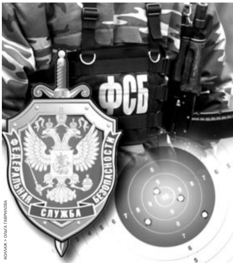
КОЛМАЖ > ОЛЬГА ГАВРИЛОВА

На их счету пресечение международной экстремистской органи-