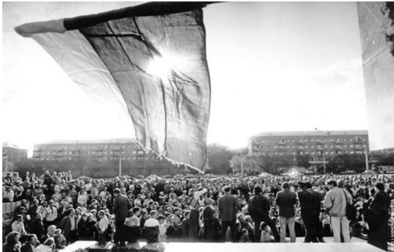
Митинг протеста в Магнитогорске на площади Народных гуляний, август 1991

Мгнитика в августе 1991-го свое отношение к ГКЧП определила сразу. Были массовые митинги протеста (как без них в то время!), звонкие выступления в газетах и на радио, пьянящее чувство свободы. До акций неповиновения, к чему призывал страну Борис Ельцин, дело, правда, не дошло. Но магнитогорский голос услышали даже в Москве. Впрочем, некоторые горожане явно не разделяли «мнение большинства». Помните, единственная в ту пору город-