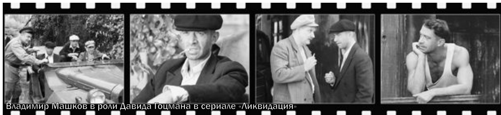
Владимир Машков в роли Давида Гоцмана в сериале «Ликвидация»

Один из главных вопросов, предложенных для обсуждения, – увеличение возраста, с которого молодежь получит право покупать алкоголь. По инициативе федеральных законодателей предлагается поднять возрастную планку с 18 лет до 21 года (именно с этого возраста получают доступ к алкоголю в США). Представители Челябинской области, участвующие в заседании экспертного совета, поддержали эту идею.