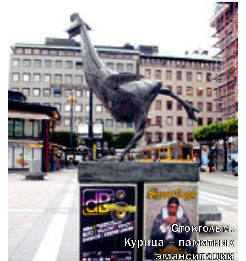
Стокгольм. Курица – памятник эмансипации