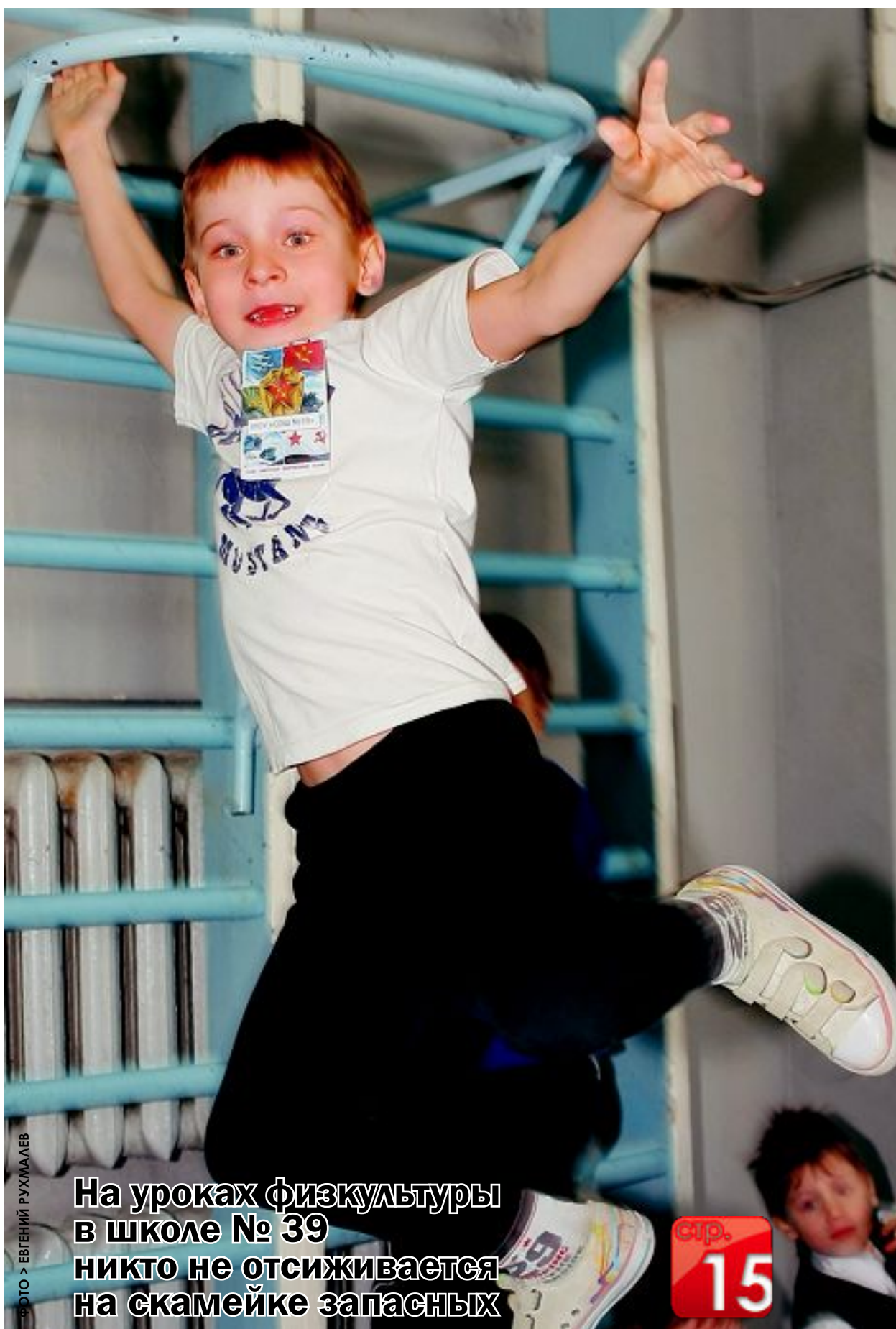
На уроках физкультуры в школе № 39 никто не отсиживается на скамейке запасных