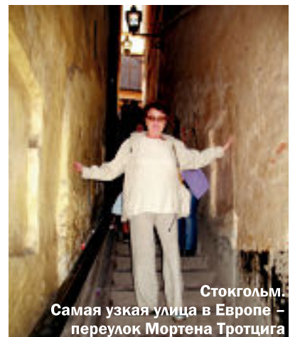
Стокгольм. Самая узкая улица в Европе – переулочек Мортена Тротцига

небольшой рынок в три длинных ряда, где продавалась масса всего съестного. От воды пахло морем, над нами кричали чайки, а временами начинал накрапывать дождь.