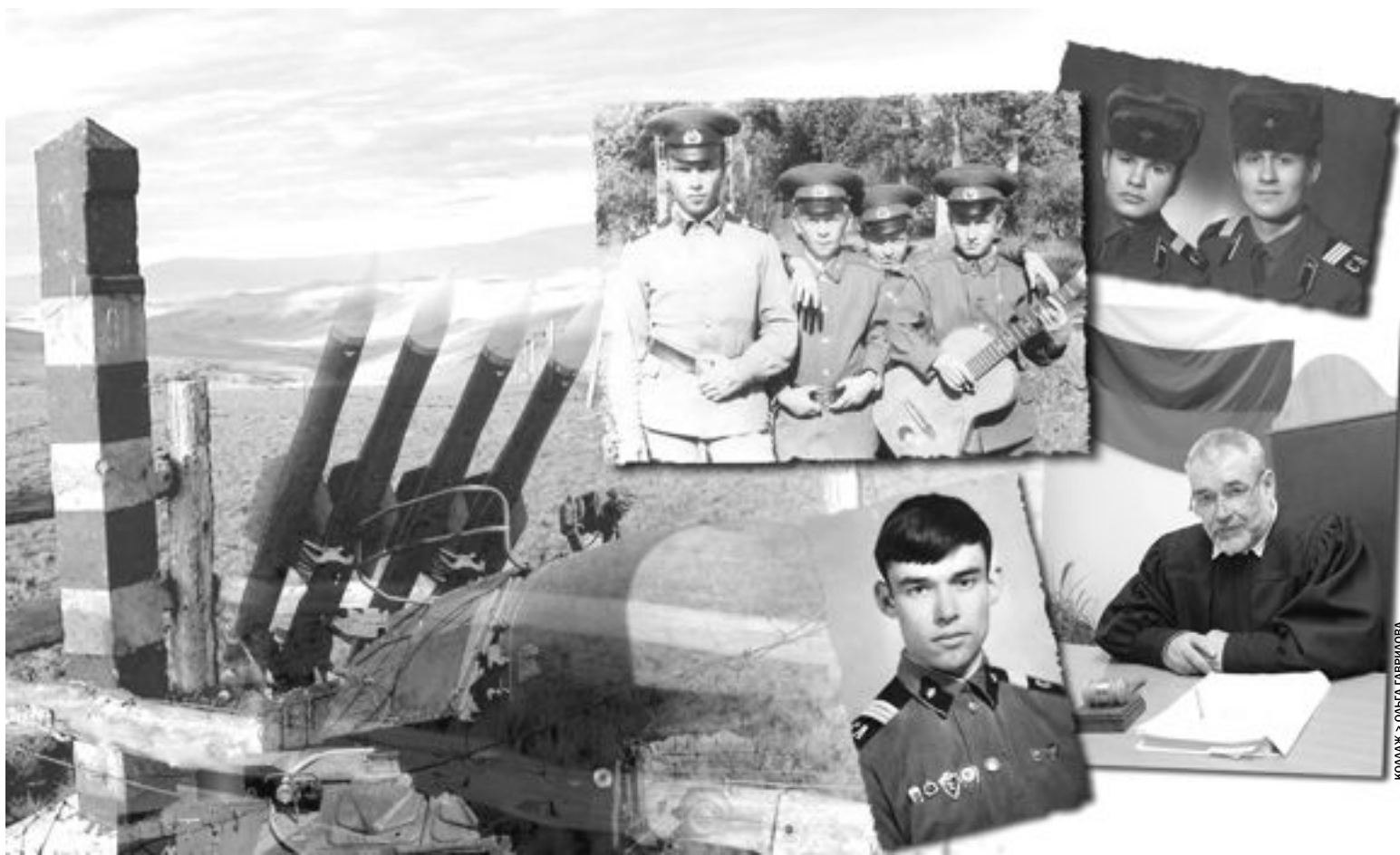
КОЛЛАЖ: ОЛЬГА ГАВРИЛОВА

Сейчас они носят судейские мантии, а когда-то ходили в армейских шинельках