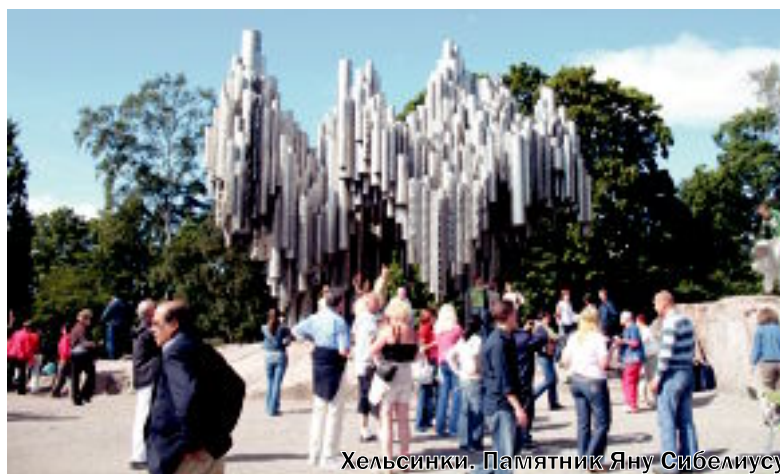
Хельсинки. Памятник Яну Сибелиусу