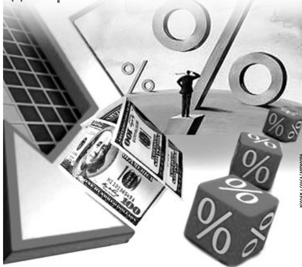
КОЛЛАЖ: ОЛЬГА ГАВРИЛОВА

Однако распространенность практики взимания комиссий придает ей «законный» вид. Для нашей компании прозрение наступило 16 июня прошлого года, когда в «Новой газете на Урале» напечатали «Кредитную слепоту», и мы узнали, что комиссии за ведение счета, рассмотрение кредитной заявки, оформление, обслуживание, выдачу кредита, досрочное погашение – в общем, за то самое «оказание финансовых услуг по предоставлению», в потребительском кредитовании незаконны. И в Интернете заемщики делятся опытом возврата комиссий, образцами исковых заявлений, списками банков, возвращающих комиссии добровольно, и «упрямых», по которым