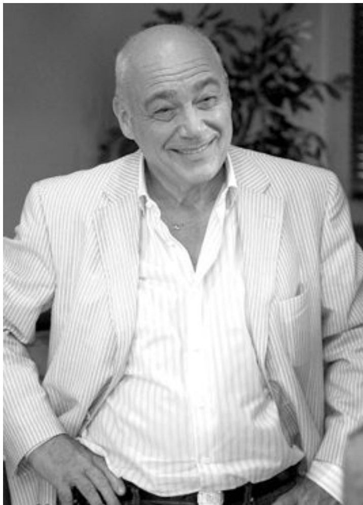
Популярного телеведущего трудно разыграть, он, как и его мама, родился в День смеха

Так что будьте настороже, запастись чувством юмора, набором свеженьких шуточек и забавных