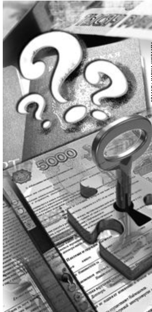
КОЛАЖ - МАРИНА НИКОЛОВА