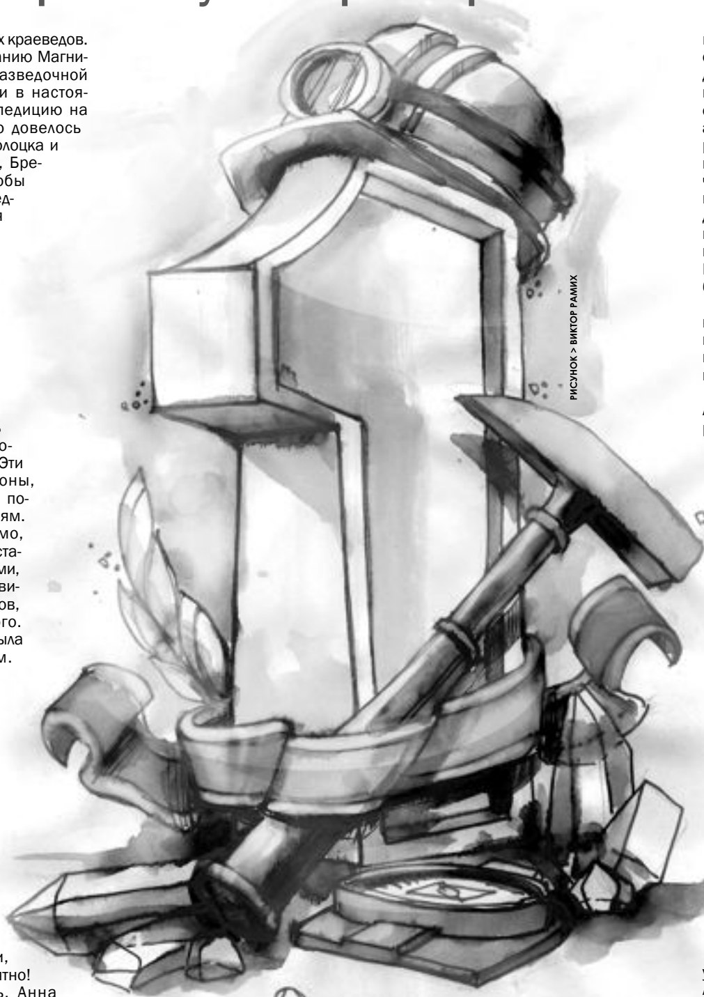
РИСУНОК > ВИКТОР ГАМИХ

Как-то под вечер к костру подкатил автокран. Из него вышло двое молодых парней в военной форме. Двое солдат из стройбата спросили нас о том, что мы тут делаем. Они были добродушны и приветливы, но чего-то не договаривали. В конце концов, поняв, что руководитель ушла с девочками в деревню за хлебом, они по-хозяйски достали две бутылки водки, булку хлеба и огромную жестяную банку селедки. Не спрашивая нас, вояки разлили всем почти по стакану, нарезали хлеб и раздали каждому по куску и огромной рыбине из бан-