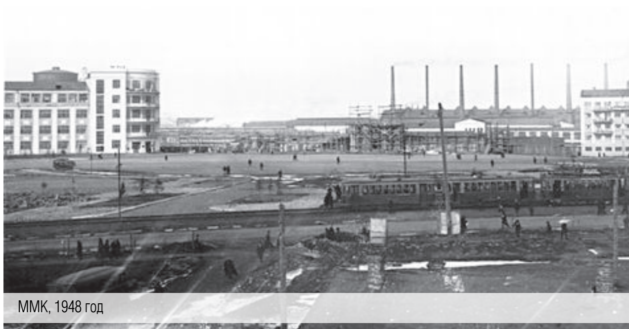
ММК, 1948 год