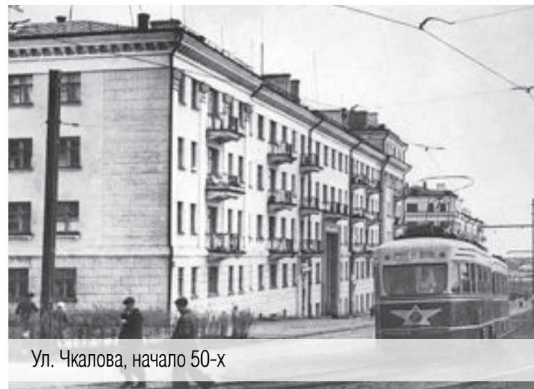
Ул. Чкалова, начало 50-х

Истинных патриотов, любящих свою малую родину, знающих её историю, очень много