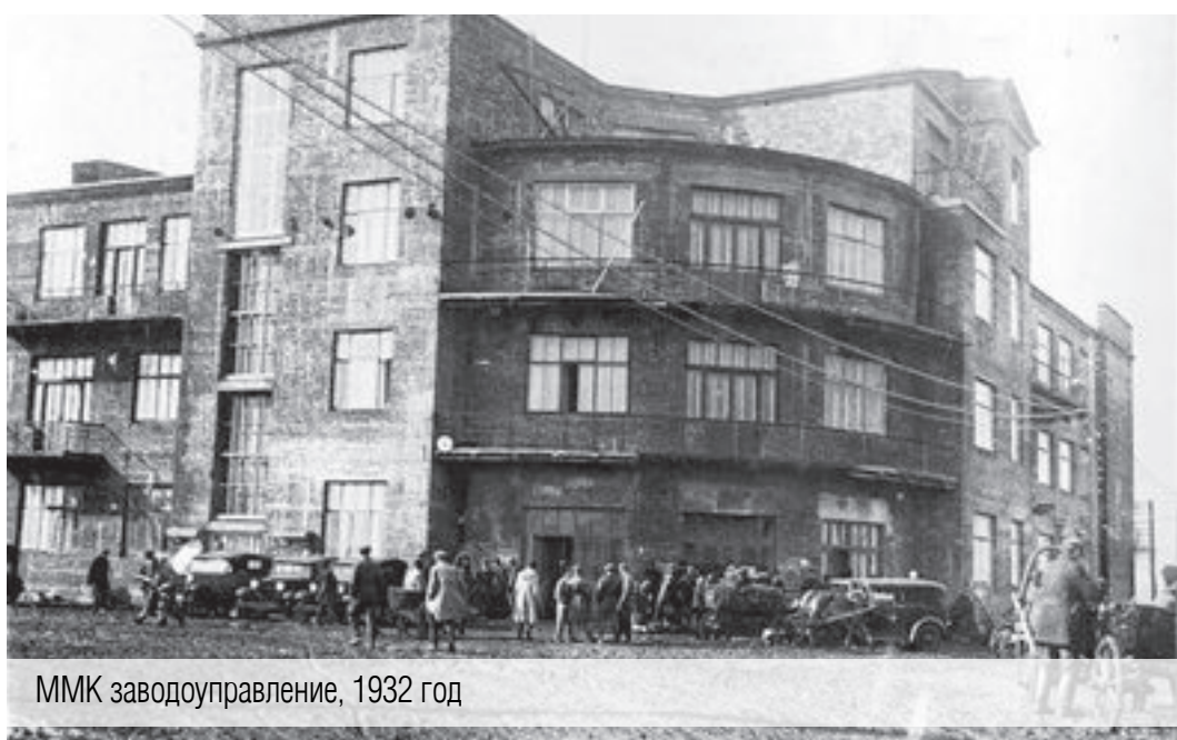
ММК заводоуправление, 1932 год