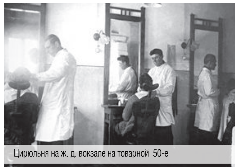
Цирюльня на ж. д. вокзале на товарной 50-е