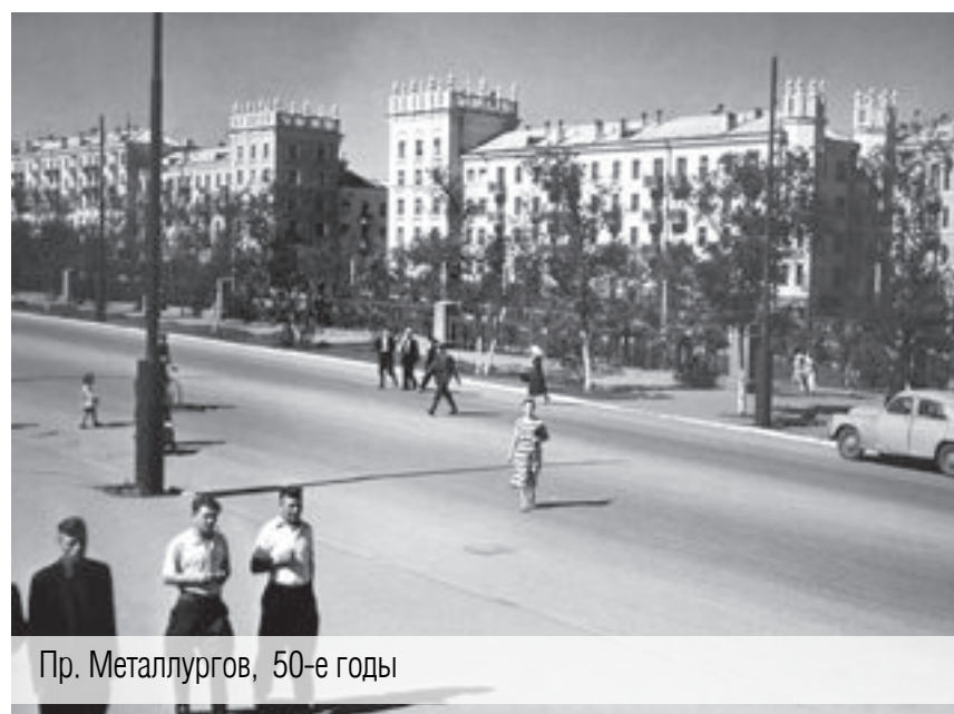
Пр. Metallургов, 50-е годы