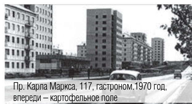
Пр. Карла Маркса, 117, гастрон. 1970 год, впереди – картофельное поле