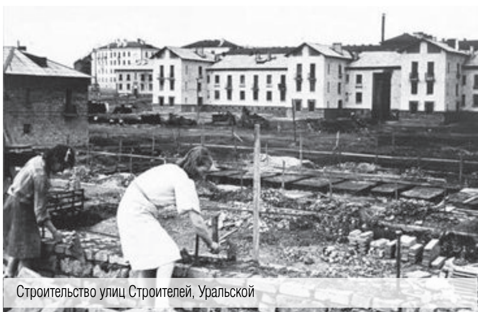
Строительство улиц Строителей, Уральской