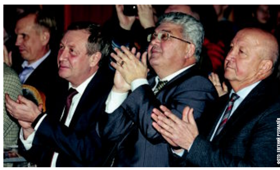
Фоторепортаж смотрите на сайте magmetall.ru