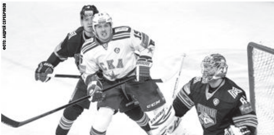
▶ Российская молодёжная команда по хоккею начнёт чемпионат мира игрой с Данией

Понятно, что «взлёт» сезона станет весенний розыгрыш Кубка Гагарина, главного трофея Континентальной хоккейной лиги. Но регулярный чемпионат впервые за семилетнюю историю КХЛ ныне приобрёл, возможно, даже более важное значение, ведь именно в нём определяются обладатели золотых, серебряных и бронзовых медалей национального чемпионата. С точки зрения нового регламента, предстоящая домашняя серия из восьми встреч, которую команда начинает сегодня, может стать ключевой для «Металлурга» в этом сезоне.