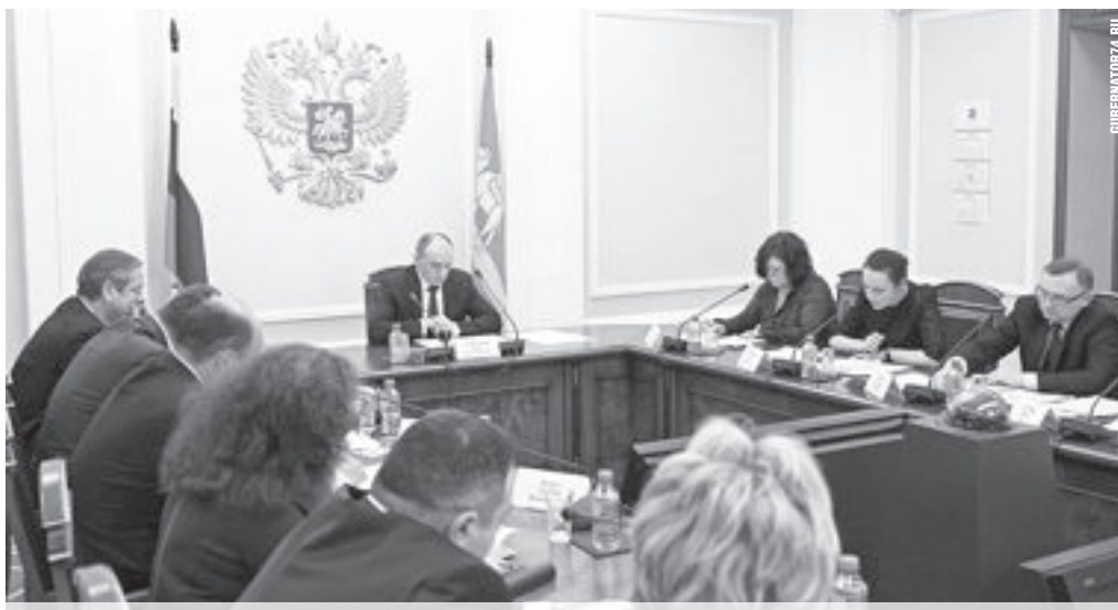
Губернатор о работе чиновников с бизнесом: «Играйте по правилам или не будете играть вообще»

Губернатор Челябинской области провёл заседание штаба по ликвидации административных барьеров для малого и среднего предпринимательства. Борис Дубровский потребовал от подчинённых создать такие условия, при которых бизнесмен «не будет замечать присутствие властей».