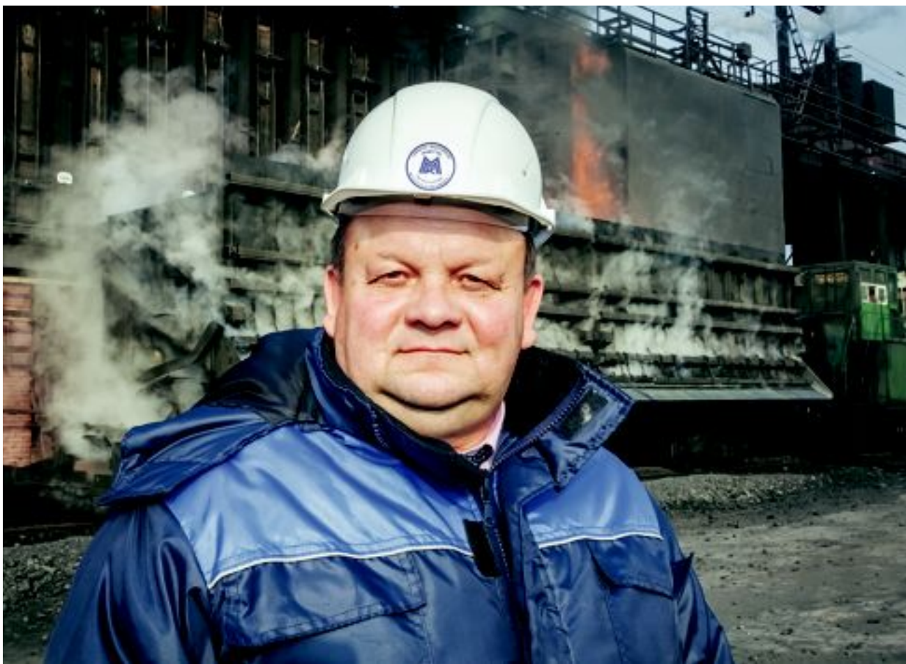
Ю. Андрей Серебряков