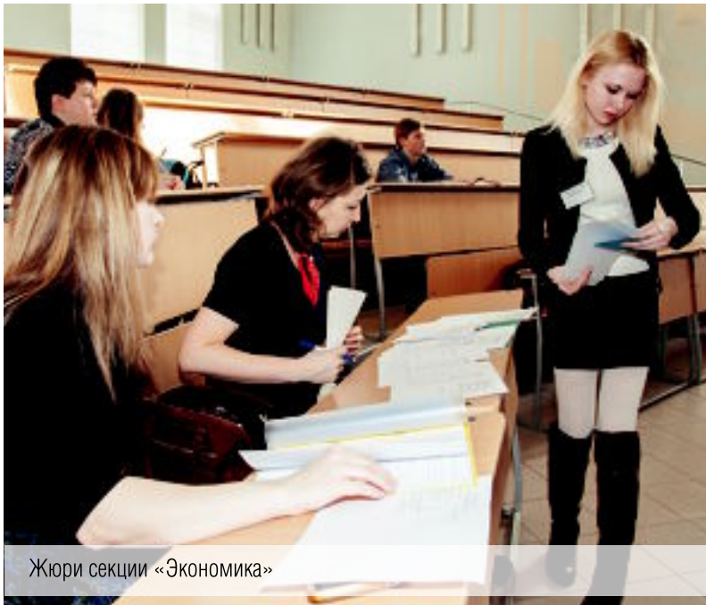
Жюри секции «Экономика»