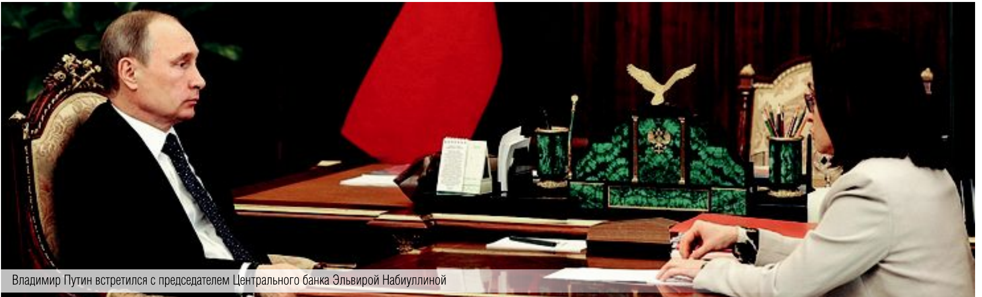
Владимир Путин встретился с председателем Центрального банка Эльвирой Набиуллиной