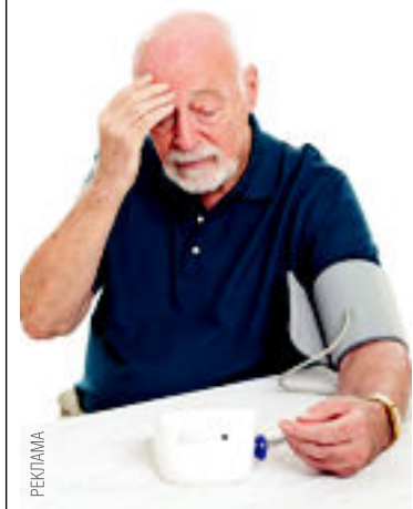
Печальная статистика жертв «тихого убийцы»...

Гипертоническая болезнь является одной из самых частых из хронических болезней человека. Гипертоников (только тех, о которых известно!) в России миллионы 12–14.