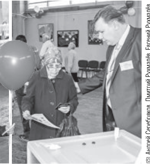
© Андрей Серебряков, Дмитрий Рухмалёв, Евгений Рухмалёв