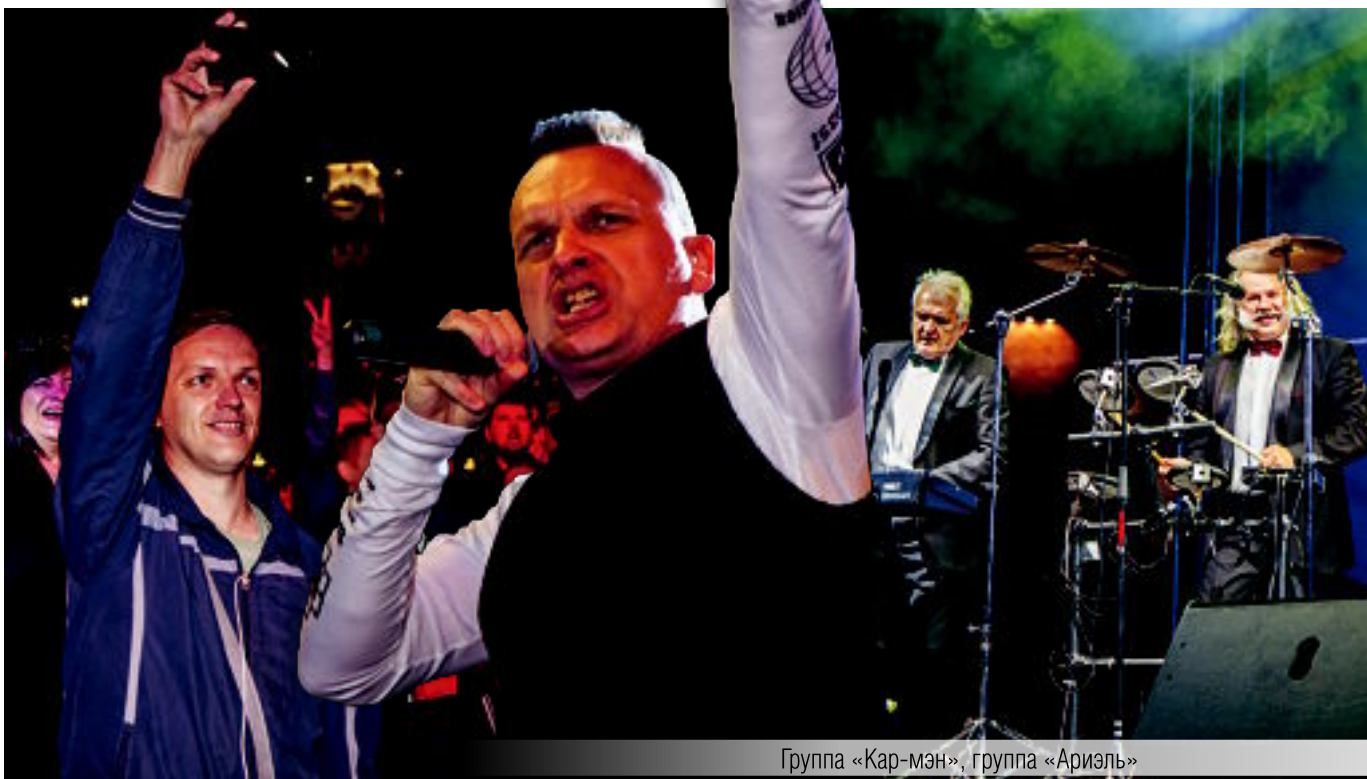
Группа «Кар-мэн», группа «Ариэль»

Фоторепортаж смотрите на сайте magmetall.ru