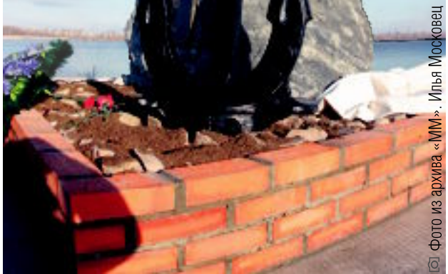
Фото из архива «ММ». Илья Московец