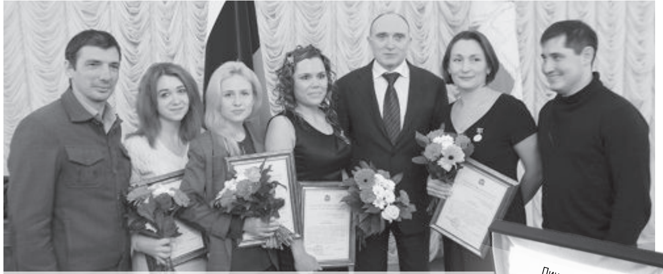
Делегация магнитогорских поисковиков с главой региона