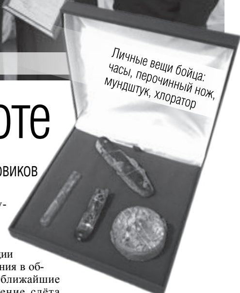
Личные вещи бойца: часы, перочинный нож, мундштук, хлоратор

Самый трогательный момент – передача личных вещей родным воинов