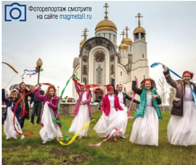
Фоторепортаж смотрите на сайте magmetall.ru