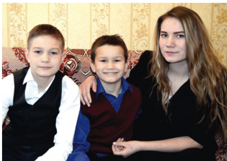
Сестра и два брата

Всесторонне развитые личности. Они не стоят на месте, постоянно в творческом поиске себя. Занимаются в творческих коллективах и спортивных секциях интерната. Великолепно владеют художественным словом, участвуют в конкурсах чтецов. Имеют личные награды и грамоты. Принимают активное участие в мероприятиях не только внутри интерната, но и за его пределами.