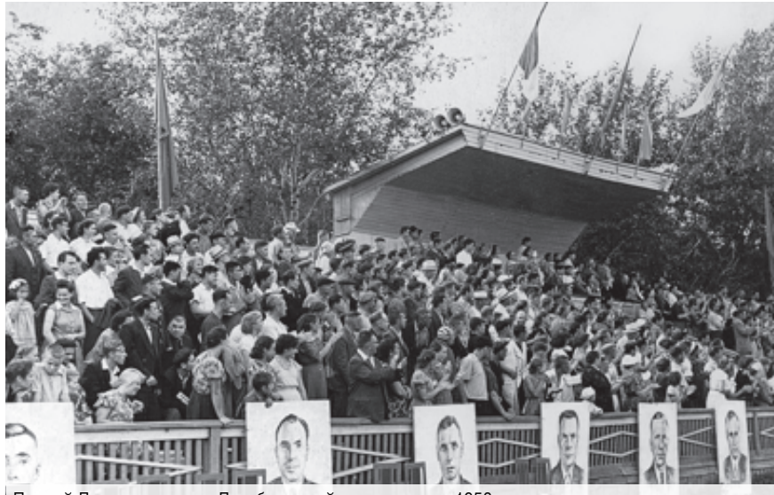
Первый День металлурга. Левобережный стадион, июль 1958 г.

День металлурга для Южного Урала в целом и для Магнитки в частности – гораздо больше, чем просто профессиональные торжества