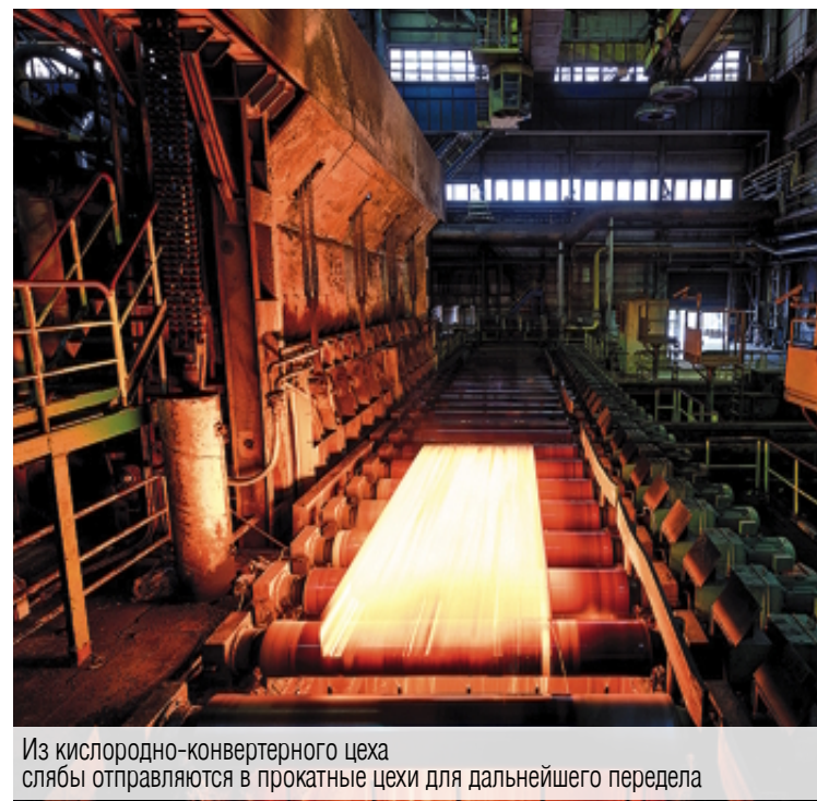
Из кислородно-конвертерного цеха слэбы отправляются в прокатные цехи для дальнейшего передела