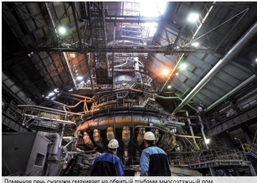
Доменная печь снаружи смахивает на оббитый трубами многоэтажный дом. Именно в доме, загрузив в неё кокс и рудный агломерат, получают чугун – сплав железа с углеродом и другими элементами