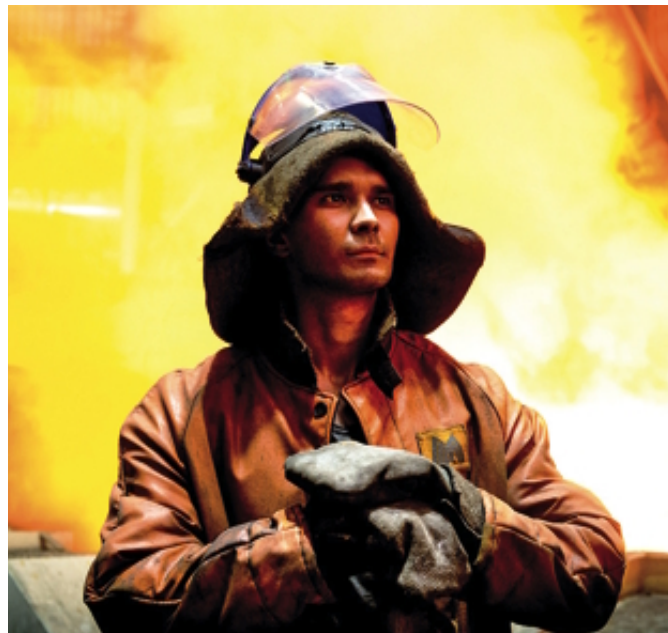
Люди в кадре помогают ощутить масштаб цехов, оборудования. Это соотношение – завораживает

Фоторепортажи с ММК вызывают всё больший интерес у пользователей интернет-ресурсов