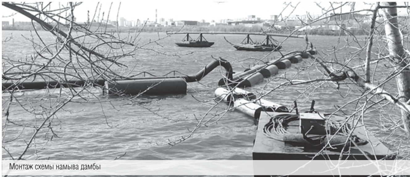
Монтаж схемы намыва дамбы