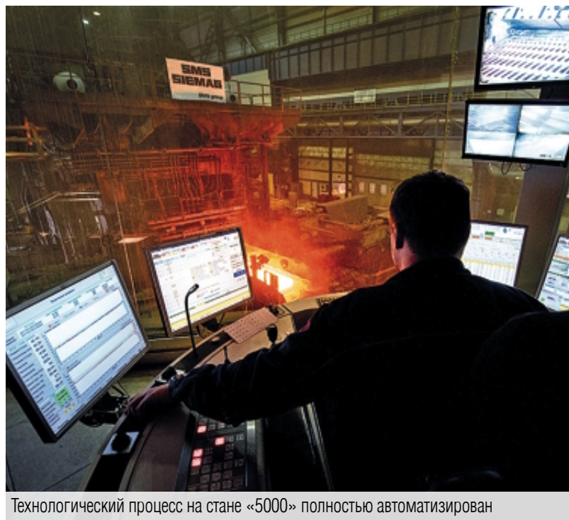
Технологический процесс на стане «5000» полностью автоматизирован