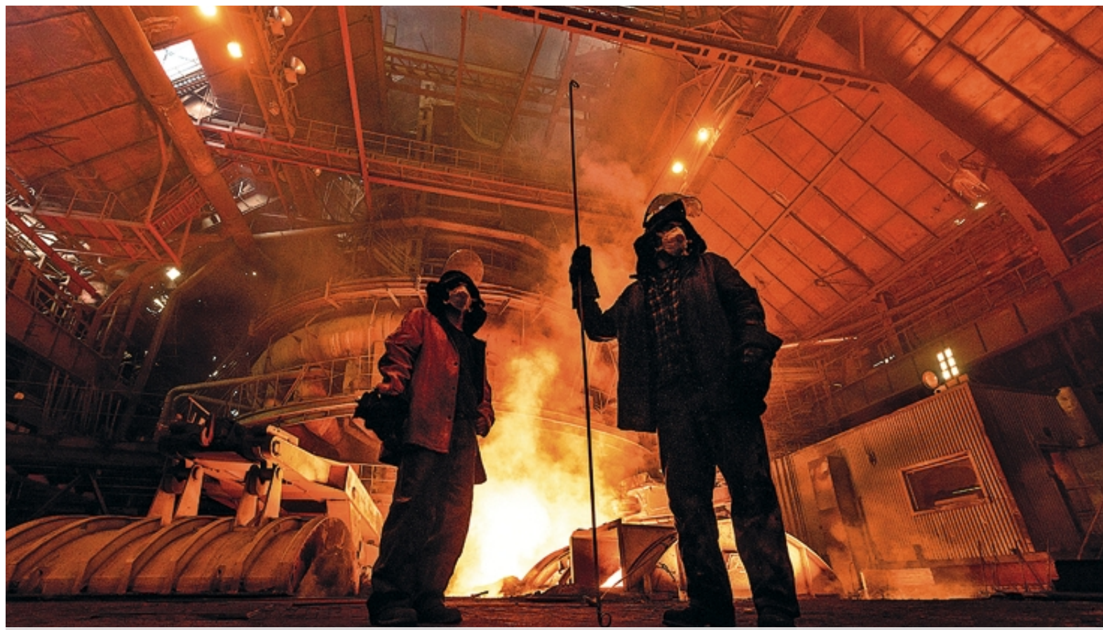
Легендарная Магнитка входила в число титульных и знаковых объектов индустрии молодого Советского Союза. В годы войны здесь ковали броню будущей Победы. А сегодня модернизированный ММК – одно из крупнейших металлургических производств страны и мира