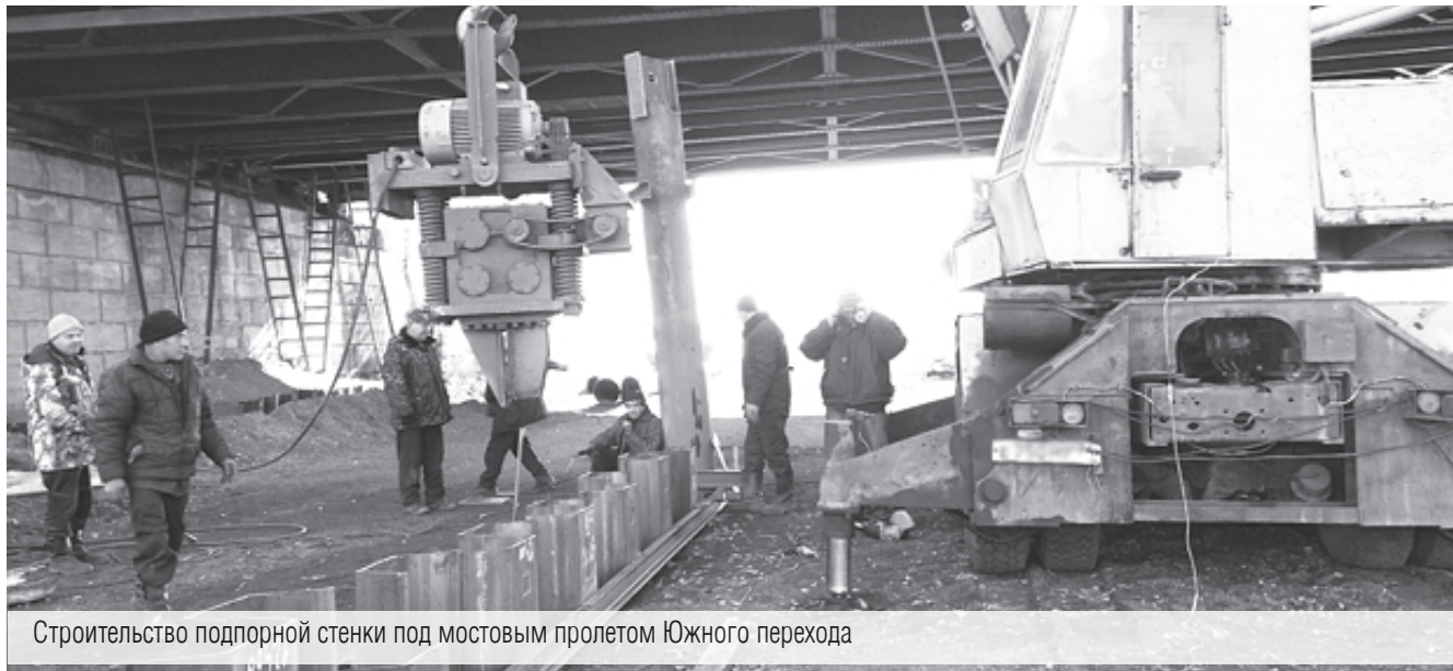
Строительство подпорной стенки под мостовым пролетом Южного перехода