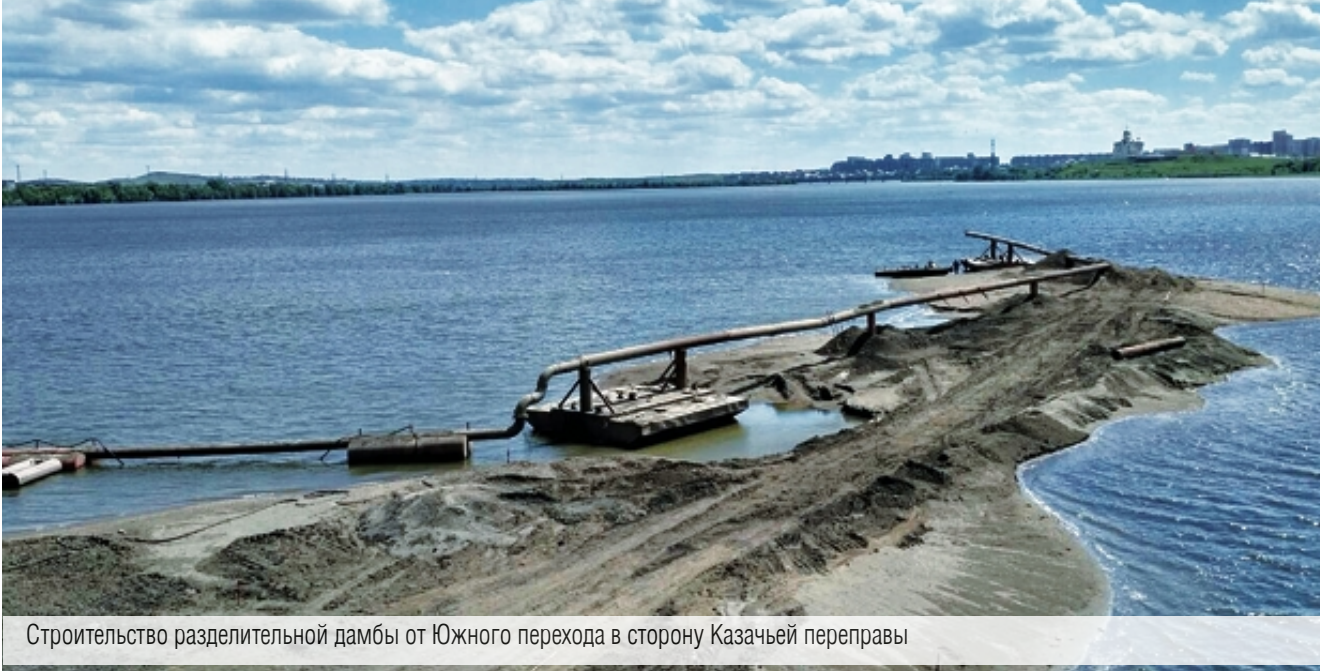
Строительство разделительной дамбы от Южного перехода в сторону Казачьей переправы