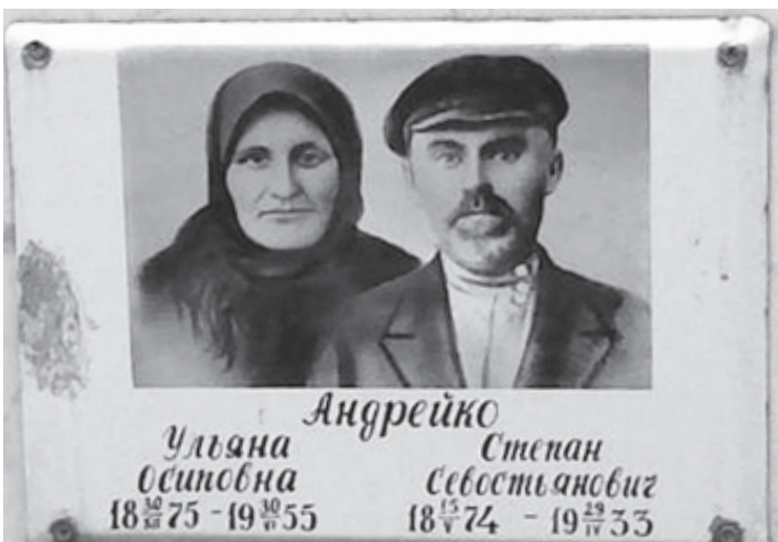
Фото родителей Героя Советского Союза Ильи Андрейко