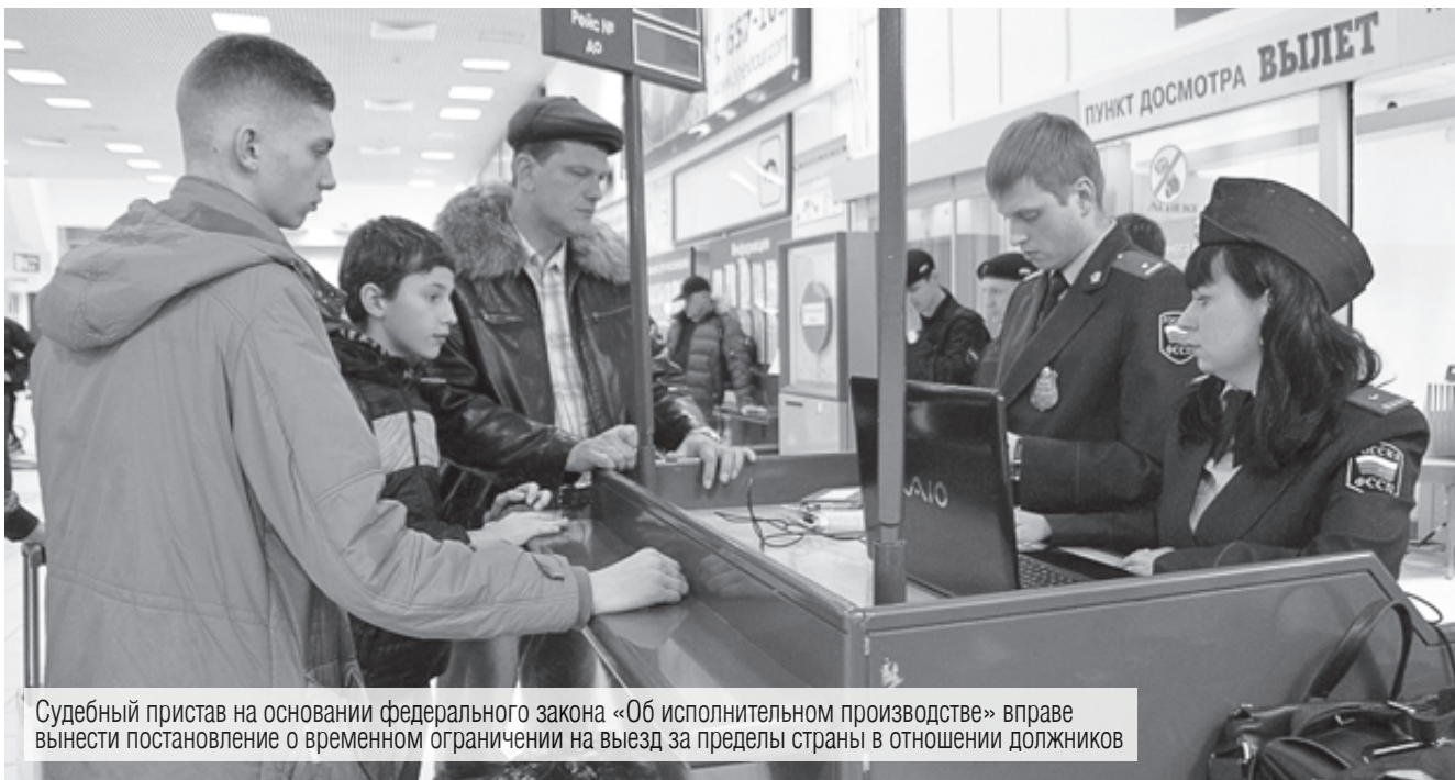
Судебный пристав на основании федерального закона «Об исполнительном производстве» вправе вынести постановление о временном ограничении на выезд за пределы страны в отношении должников

Активное взаимодействие службы судебных приставов и налоговых органов позволяет пополнять бюджеты всех уровней