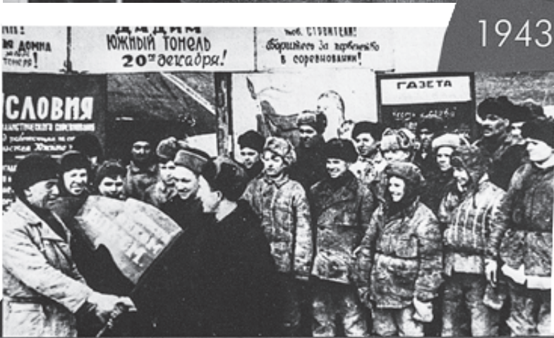
Лучшая бригада строителей доменной печи № 6