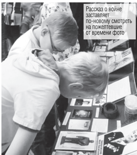
Рассказ о войне заставляет по-новому смотреть на пожелтевшие от времени фото