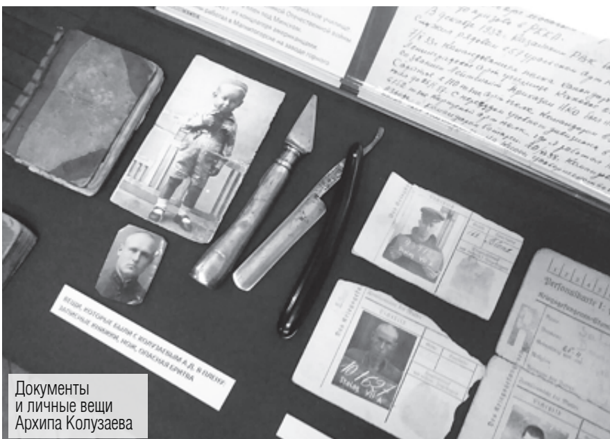
Документы и личные вещи Архипа Колузаева