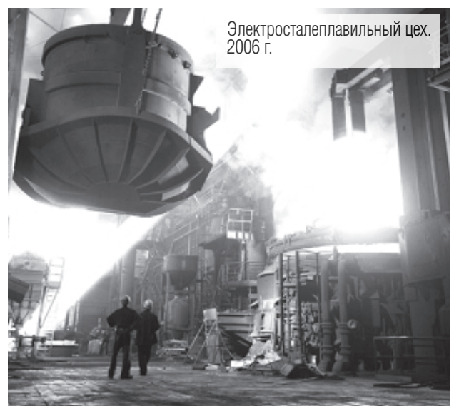
Электросталеплавильный цех, 2006 г.