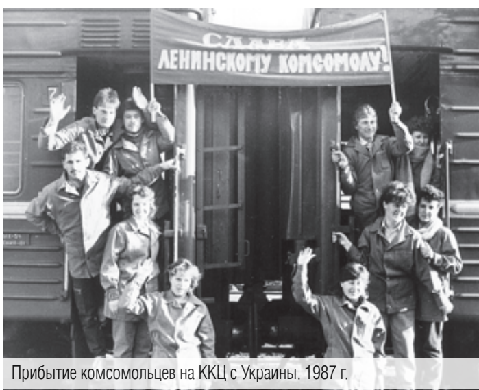
Прибытие комсомольцев на ККЦ с Украины, 1987 г.