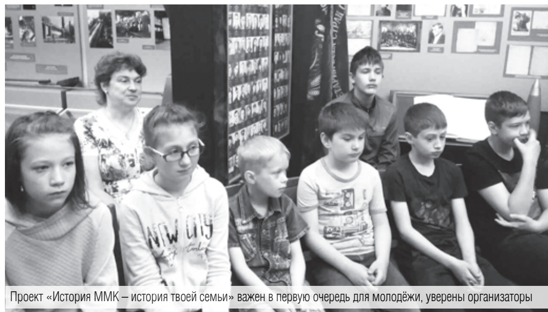
Проект «История ММК – история твоей семьи» важен в первую очередь для молодёжи, уверены организаторы