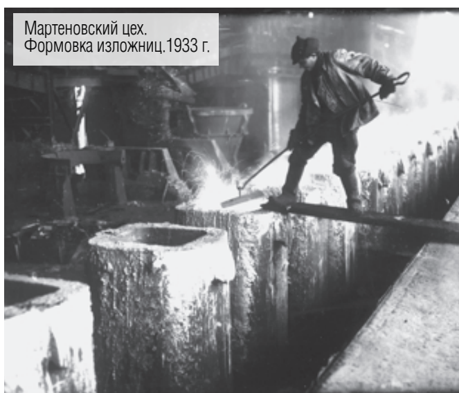
Мартеновский цех. Формовка изложниц, 1933 г.