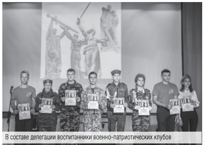
В составе делегации воспитанники военно-патриотических клубов