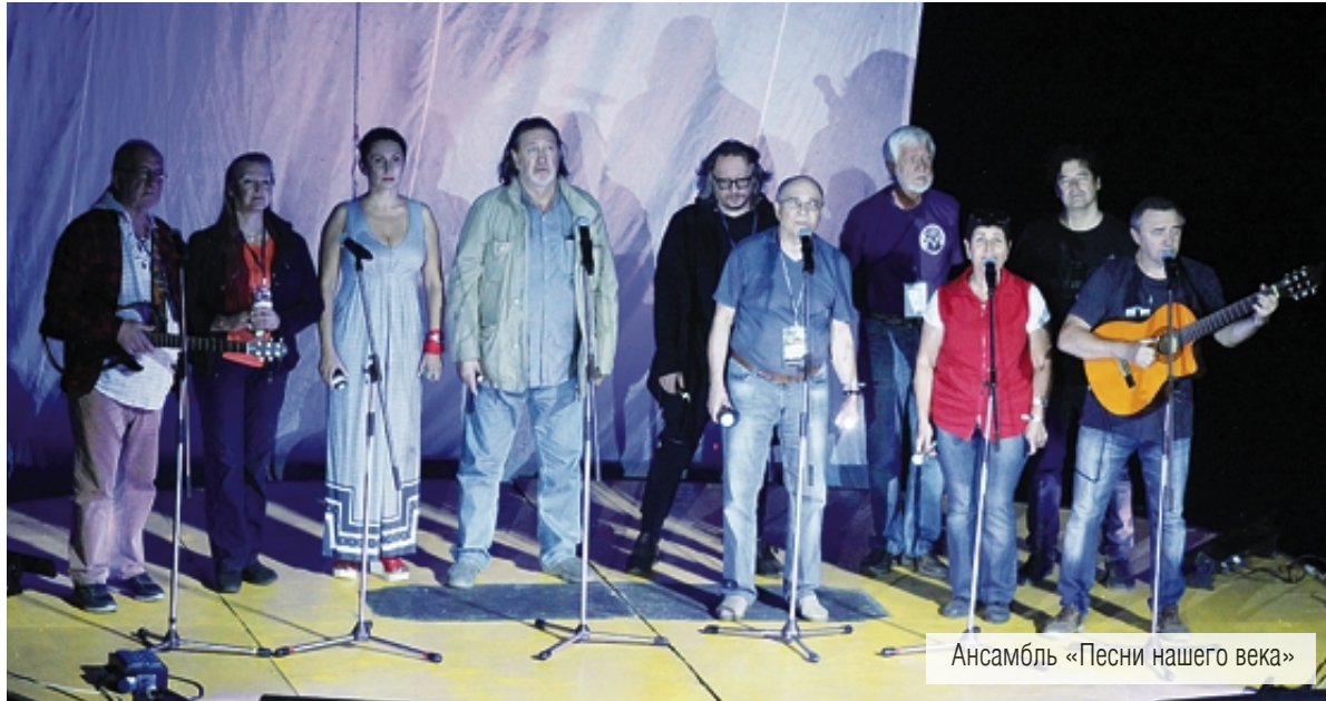
Ансамбль «Песни нашего века»

Грушинский фестиваль порадовал долгожданными встречами и удивительными открытиями