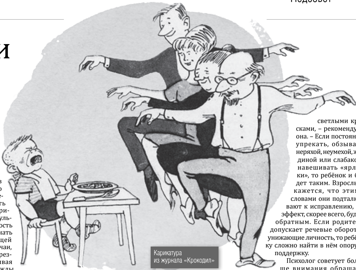
Карикатура из журнала «Крокодил»