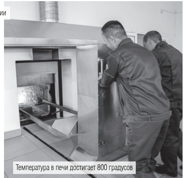
Температура в печи достигает 800 градусов