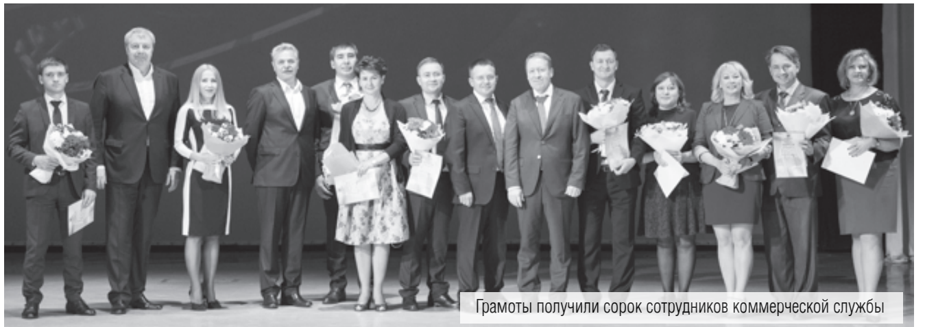
Грамоты получили сорок сотрудников коммерческой службы