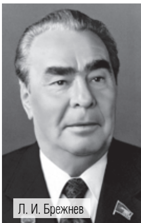
Л. И. Брежнев