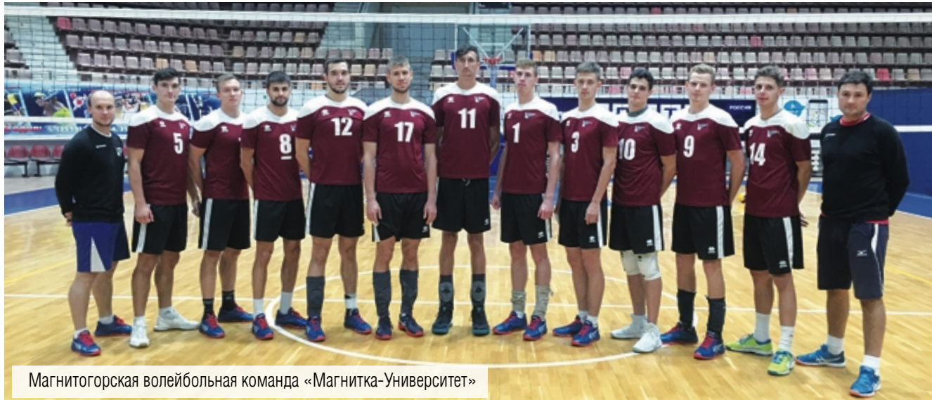
Магнитогорская волейбольная команда «Магнитка-Университет»