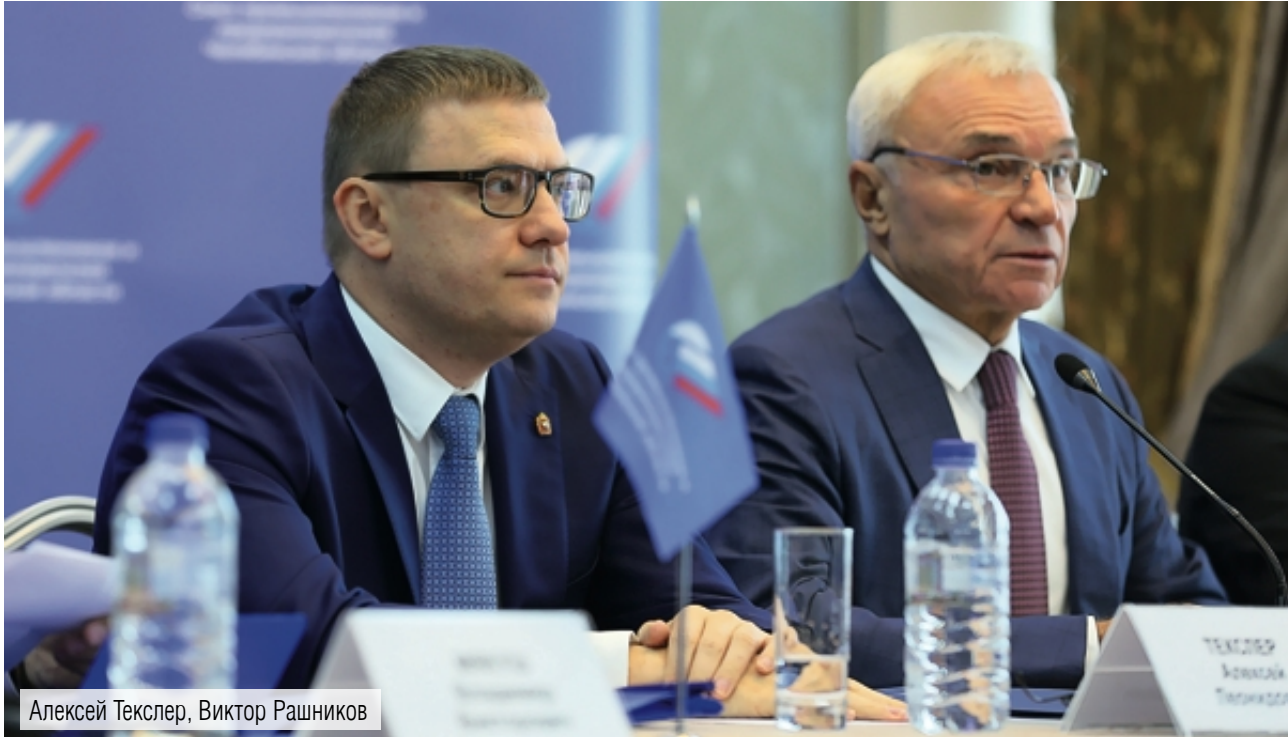
Алексей Текслер, Виктор Рашников