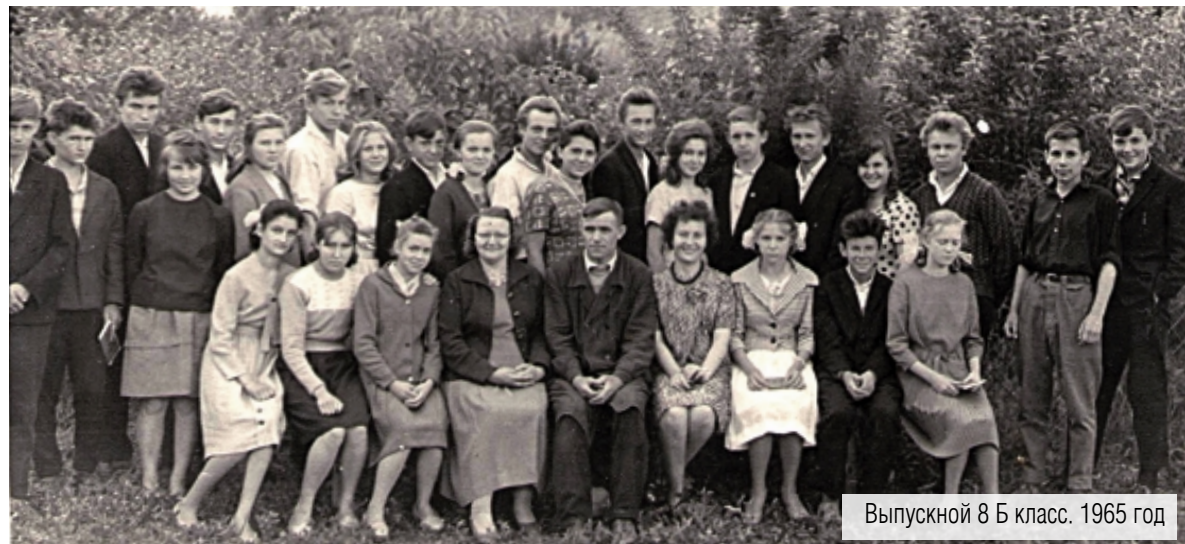
Выпускной 8 Б класс. 1965 год

подтверждение сказанного представляю школьные фотографии. Мы, конечно же, гордимся, что наш одноклассник достиг таких высот. Желаем ему и дальнейших успехов на этом поприще.