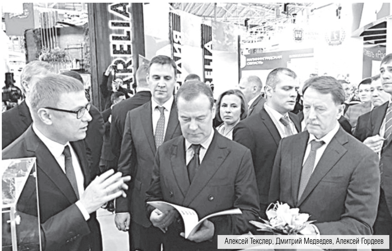
Алексей Текслер, Дмитрий Медведев, Алексей Гордеев