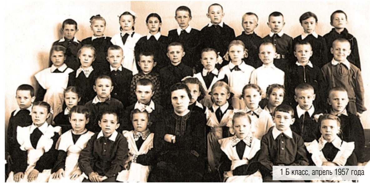
1 Б класс, апрель 1957 года

«Магнитогорский металл» даёт читателям возможность поделиться своей историей