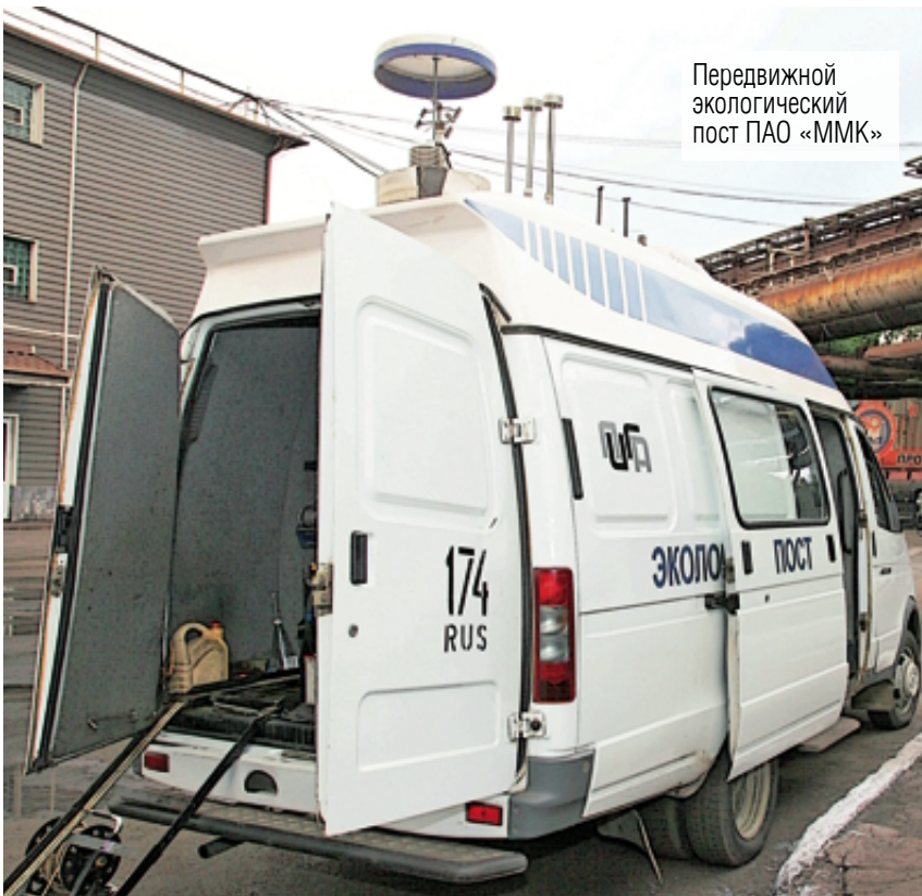
Передвижной экологический пост ПАО «ММК»

Реализацию национальных экологических проектов обсудили в главном управлении по труду и занятости региона