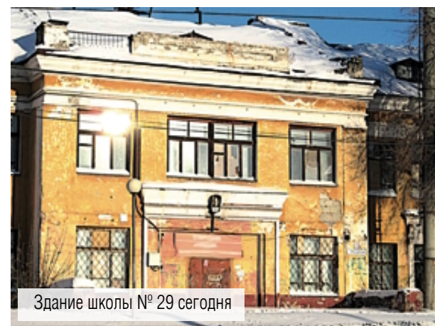
Здание школы № 29 сегодня