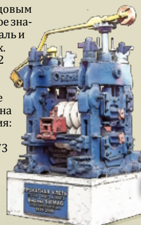
9 Прокатная клеть возле сортового цеха

7 А возле локомотивного цеха в августе 1973 года установили на постамент последний паровоз. Это событие возвестило о начале электровозной эры на ММК. Прежде чем въехать на постамент, паровоз № 7 дал прощальный гудок и затих навсегда.