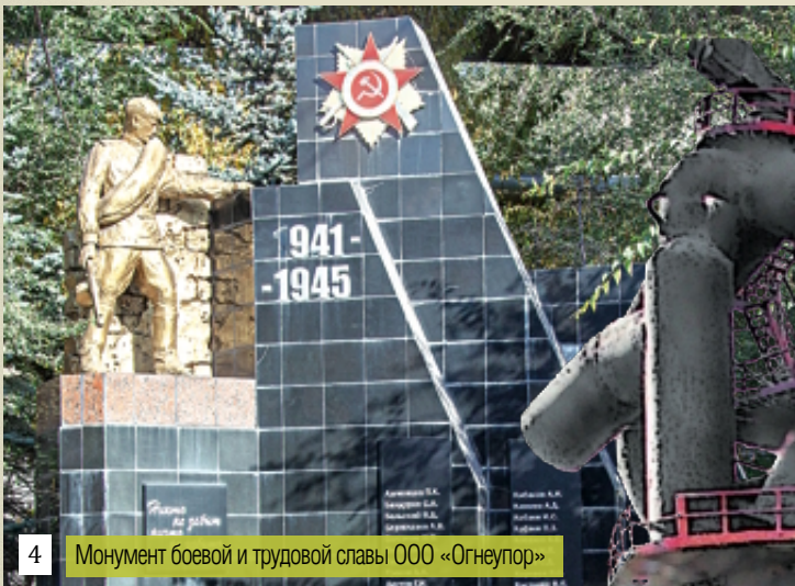
4 Монумент боевой и трудовой славы ООО «Огнеупор»