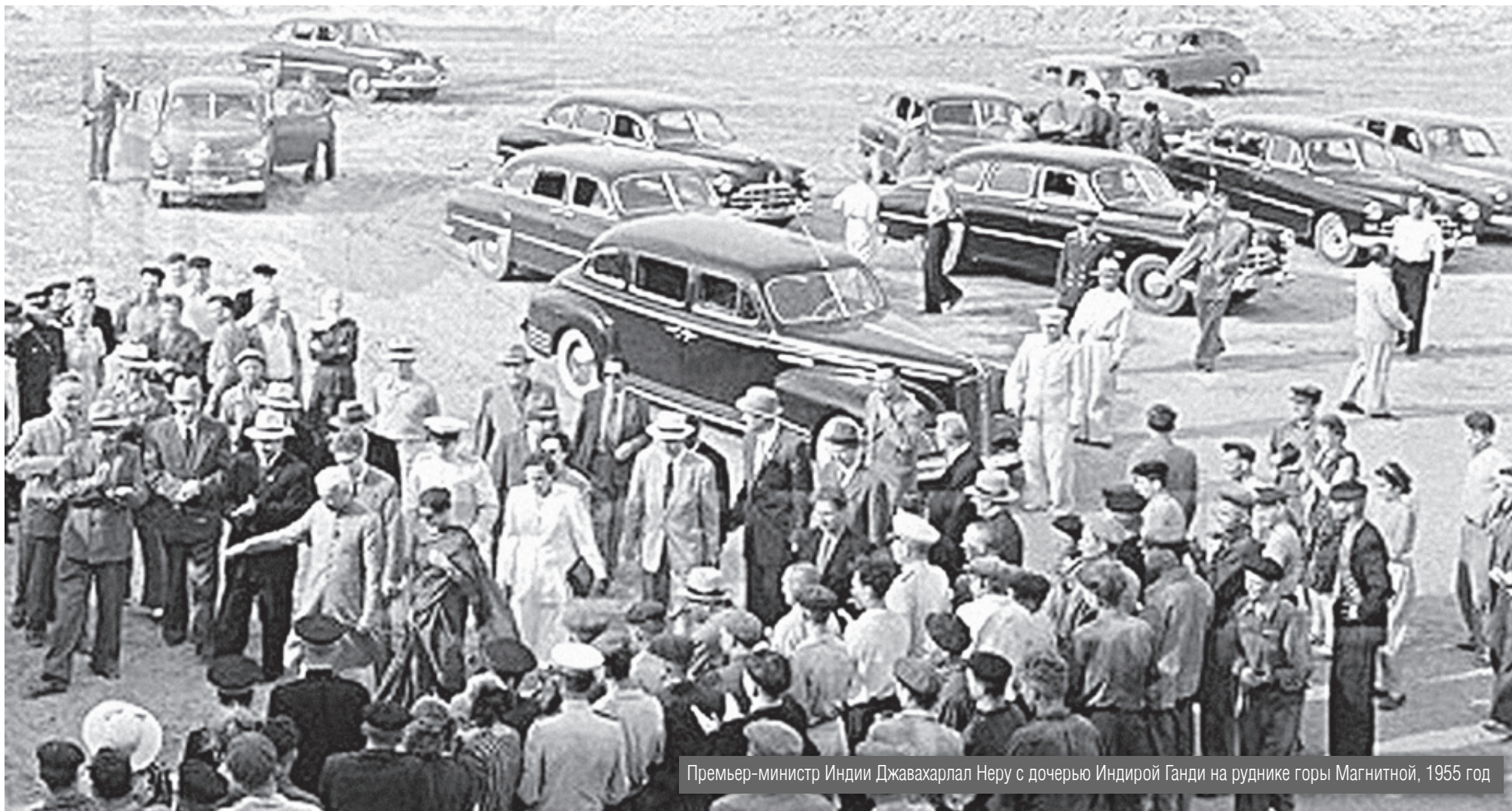
Премьер-министр Индии Джавахарлал Неру с дочерью Индирой Ганди на руднике горы Магнитной, 1955 год

Продолжение. Начало в № 33, 37, 39, 45, 84, 85, 94, 96, 97, 102, 105