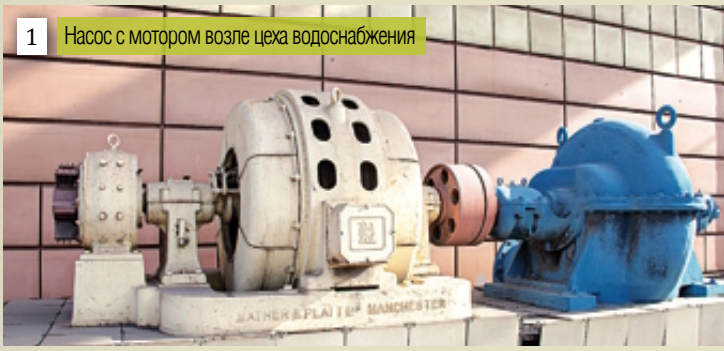
1 Насос с мотором возле цеха водоснабжения

На территории ММК установлено немало памятников и памятных знаков, по которым вполне можно изучать историю предприятия. Большую часть из них составляют фрагменты старого оборудования.