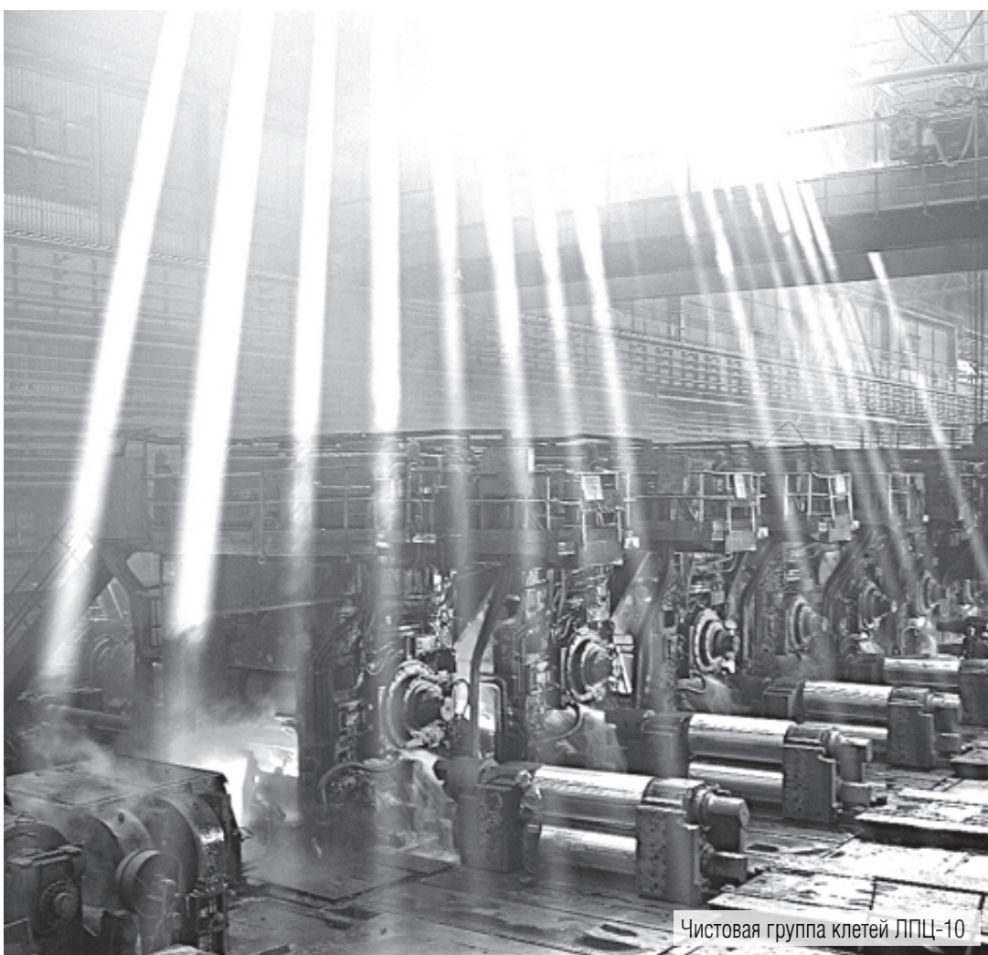
Чистовая группа клетей ЛПЦ-10