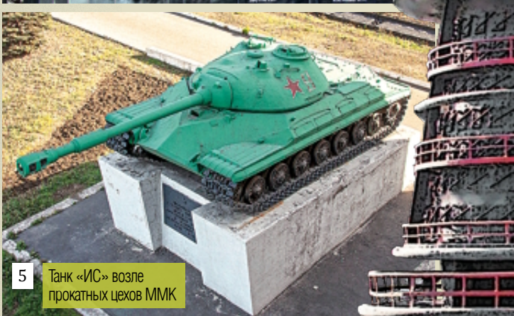
5 Танк «ИС» возле прокатных цехов ММК