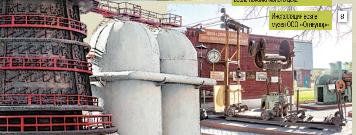
8 Инсталляция возле музея ООО «Огнеупор»

1 Возле административного здания цеха водоснабжения на пьедестале красуется насосный агрегат с двигателем. На комбинат его привезли из Англии в 1932 году, и с тех пор он исправно трудился на первой насосной станции, качая воду для нужд производства, пока не стал памятником.