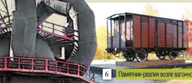
6 Памятник-реалия возле вагонного цеха