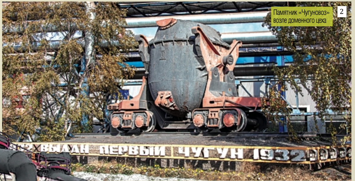
2 Памятник «Чугуновоз» возле доменного цеха