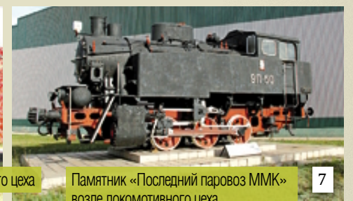
7 Памятник «Последний паровоз ММК» возле локомотивного цеха