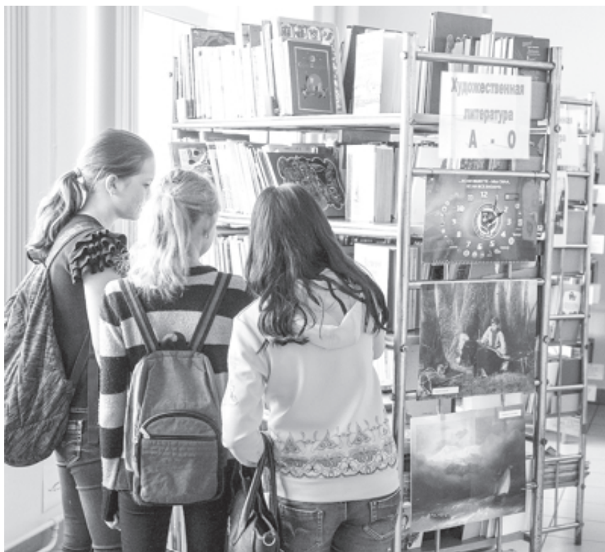
Из архива «ММ» Евгений Румалеёв

Ежегодно в библиотеках Магнитки выдают более двух миллионов книг