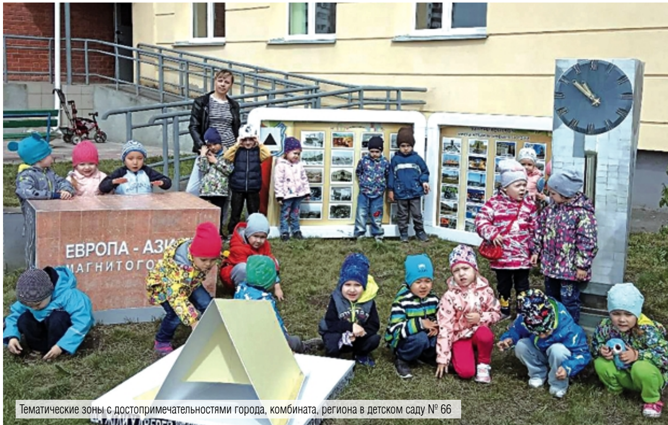
Тематические зоны с достопримечательностями города, комбината, региона в детском саду № 66

На большом аппаратном совещании глава города наградил руководителей детских садов и школ, чья территория признана самой лучшей