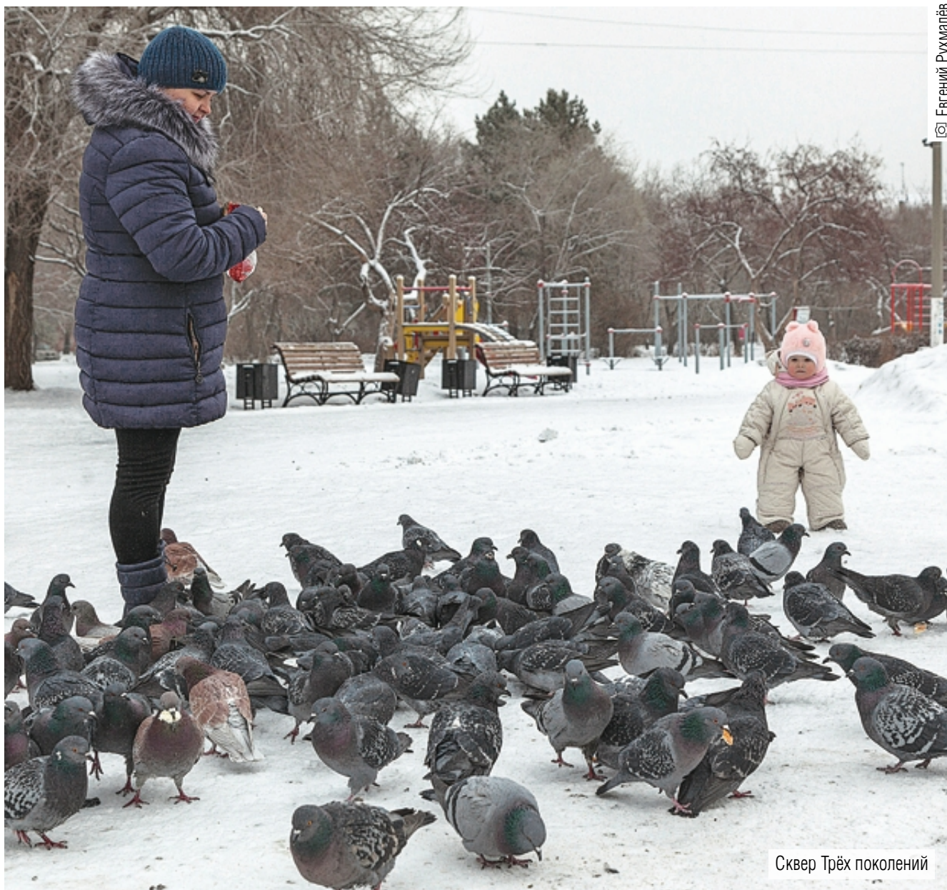
Сквер Трёх поколений

Сквер, созданный как «символ светлого будущего», оказался в «тусклом настоящем»