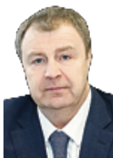
☞ Виталий Бахметьев, депутат Государственной Думы ФС РФ

Вы обеспечиваете наполнение бюджетов всех уровней, это, в свою очередь, способствует поступательному развитию экономики страны, повышению качества жизни граждан. Собранные в полном объеме налоги – это зарплаты бюджетников и пенсии, пособия и субсидии, строительство дорог и жилья. Желаю вам и впредь успешно преодолевать любые трудности, выполнять и перевыполнять поставленные задачи. Благодарю за достойную службу! Желаю крепкого здоровья, стабильной и плодотворной работы.