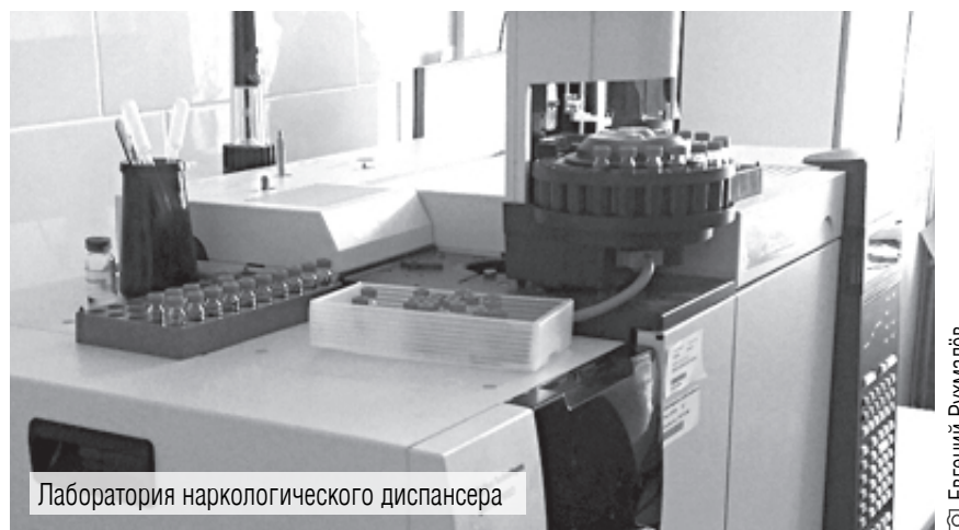
Лаборатория наркологического диспансера