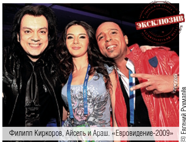
Филипп Киркоров, Аysel и Араш. «Евровидение-2009»

– изобретение бразильских авиаконструкторов «Эмбраер» на вид по размеру кажется меньше своих собратьев-конкурентов, но отличается удобным и весьма просторным салоном, в проходе которого легко работала стюардесса предпенсионного возраста и, скажем так, весомого размера. Она важно рассказывала между сиденьями, разнося воду и бутерброды, как ни странно, включённые в лоукостерс-билеты, и вообще чувствовала себя хозяйкой положения – видимо, это восточное почтение к возрасту.