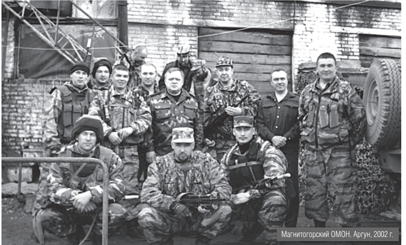
Магнитогорский ОМОН. Аргун, 2002 г.

Первый этап кампании завершился в 1996 году Хасавюртовскими соглашениями. В течение трёх последующих лет обстановка в непризнанной республике усугубилась криминализацией жизни и распространением ваххабизма. В 1999 году боевики Басаева и Хаттаба пытались провести военную операцию в Дагестане, организовали теракты в Буйнакске, взорвали многоэтажные дома в Москве и Волгодонске, что стало поводом для начала второго этапа боевых действий.