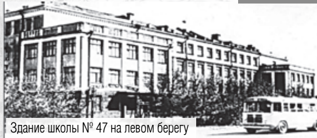
Здание школы № 47 на левом берегу