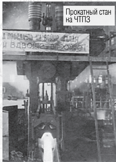
Прокатный стан на ЧТПЗ