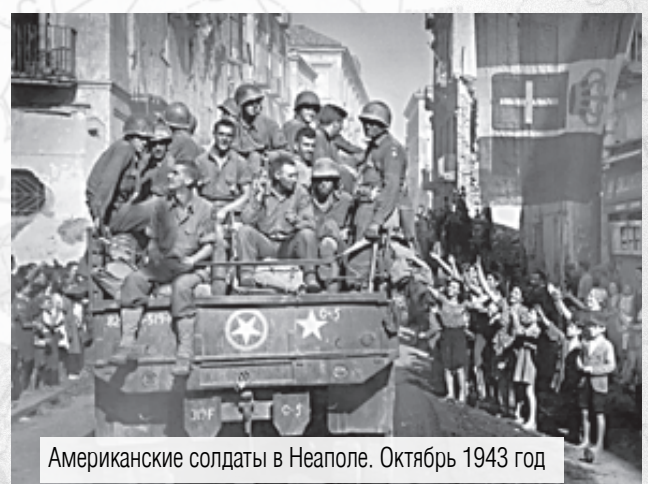
Американские солдаты в Неаполе. Октябрь 1943 год