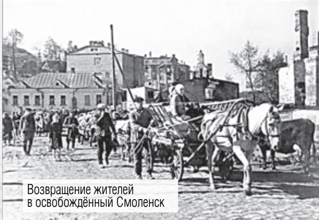
Возвращение жителей в освобождённый Смоленск

прогремело двадцать артиллерийских залпов из двухсот двадцати четырёх орудий.