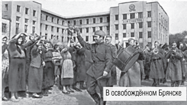
В освобождённом Брянске