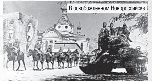
В освобождённом Новороссийске

ный город. На улицах не было видно ни одного жителя. Разгромлены предприятия, школы и другие образовательные учреждения. Полному разграблению подверглись учреждения культуры: музеи, библиотеки, театры.