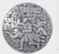
Памятная медаль «Битва у Ленино»