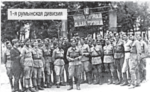
1-я румынская дивизия