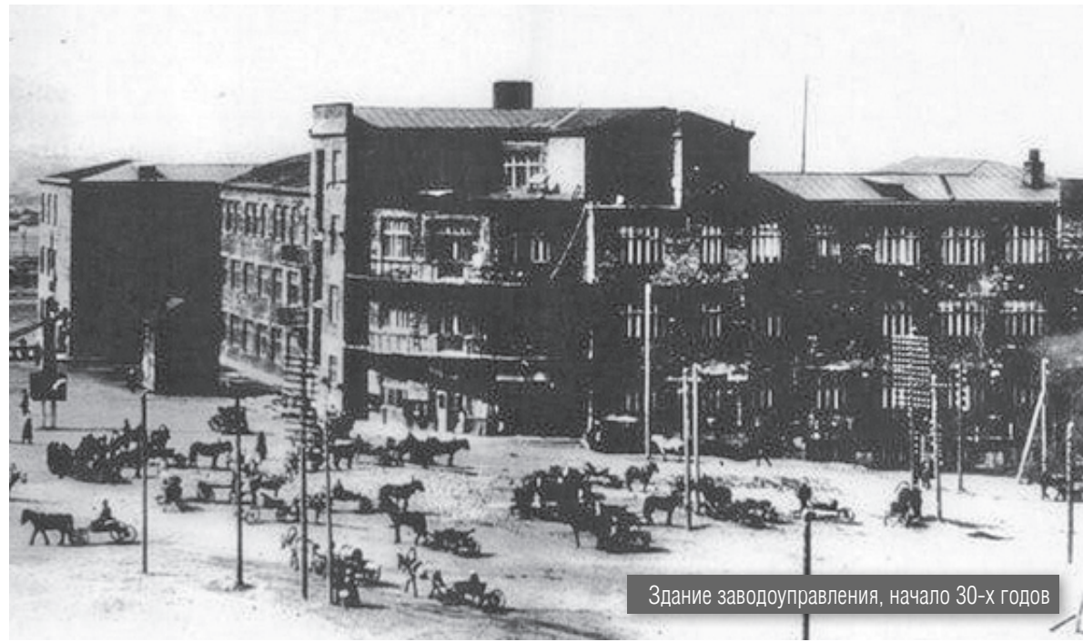
Здание заводууправления, начало 30-х годов