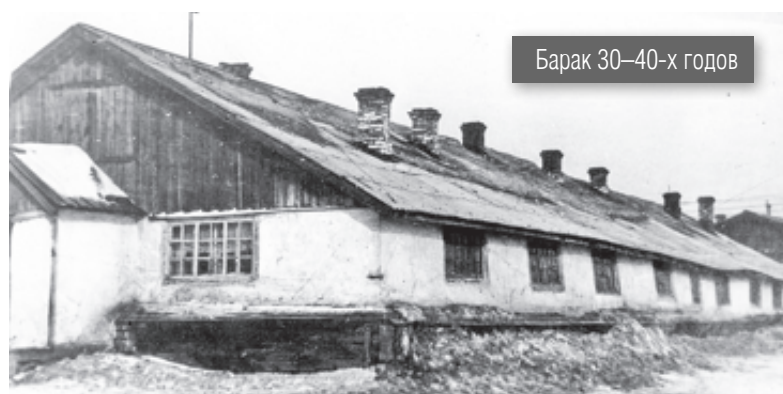
Барак 30-40-х годов