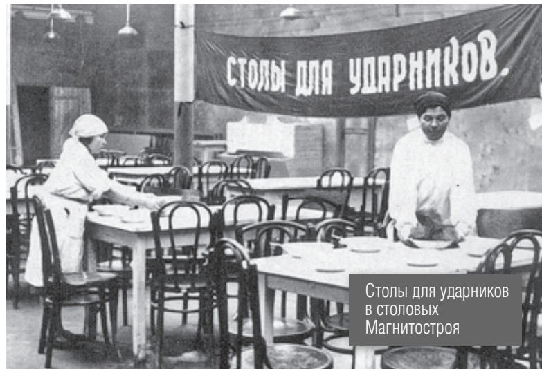
Столы для ударников в столовых Магнитостроя