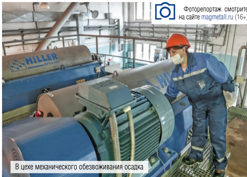
В цехе механического обезвоживания осадка

Технология очистки стоков включает три этапа: механическую и биологическую очистку, удаление тяжёлых металлов и обеззараживание с помощью ультрафиолета. С 2016 года трест «Водоканал» выполнил проектирова-