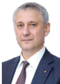
Сергей Бердников, глава города

Уважаемые работники налоговых органов! От всей души поздравляю вас с профессиональным праздником!