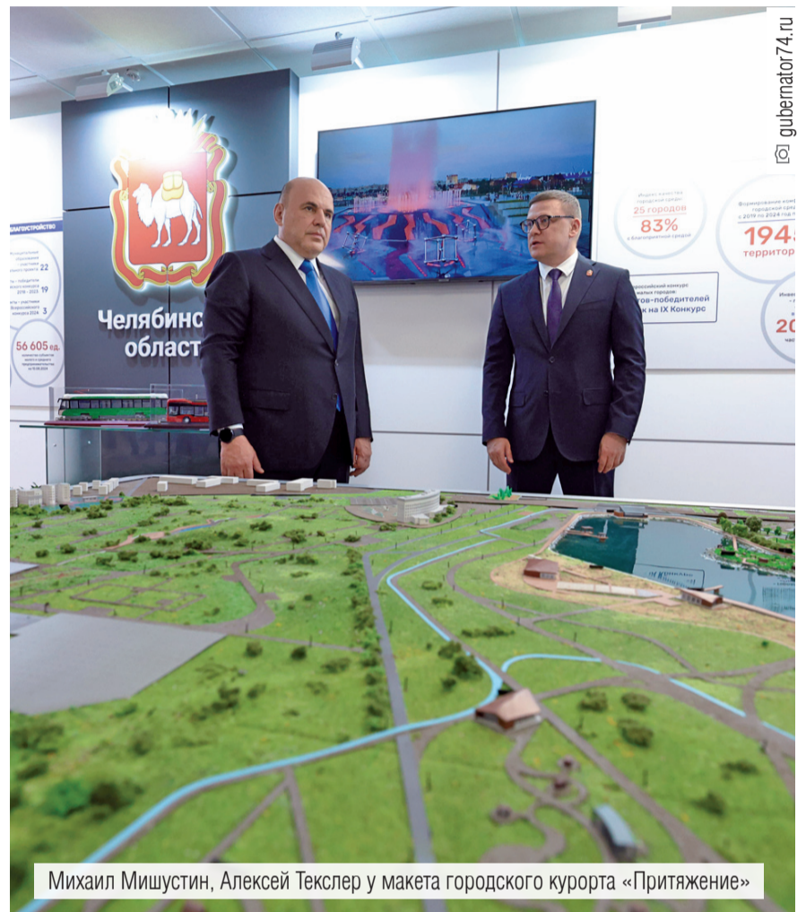
Михаил Мишустин, Алексей Текслер у макета городского курорта «Притяжение»

Напомним, что в первой очереди мультифункционального паркового пространства были введены в эксплуатацию 27 гектаров территории со светомузыкальным фонтаном, центральной детской площадкой, фудмоллом, роллер-парком, который зимой становится катком, дорожками для пешеходов и велосипедистов. В парке высадили 1500 деревьев, 50 тысяч кустарников, 330 тысяч многолетних цветов. В 2023 году освоено ещё 105 гектаров парка. Возведён видовой холм высотой 36 метров с всесезонными трассами для