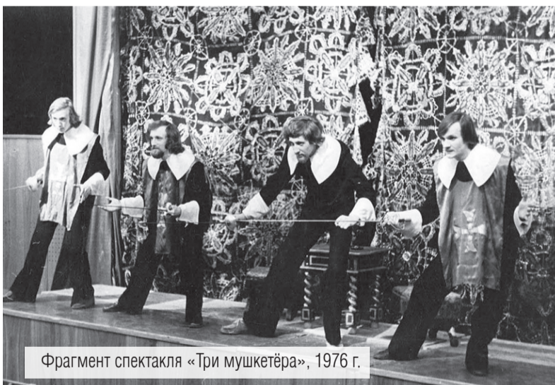
Фрагмент спектакля «Три мушкетёра», 1976 г.

Наталии Красильниковой. И это не удивительно: сказка Алексея Толстого любима детворой и в СССР, и в наше время. И каждое новое поколение мальчишек и девчонок, приходя в театр «Буратино», спрашивает: «А где же сам Буратино? Есть про него спектакль?»