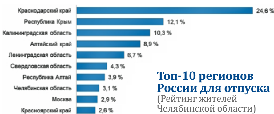
Топ-10 регионов России для отпуска (Рейтинг жителей Челябинской области)

Из тех, кто запланировал отпуск до конца года, 42 процента намерены отправиться в путешествие по России. Все прочие варианты отдыха гораздо менее популярны. Так, отправиться в поход или на пикники собираются 30 процентов, заниматься бытовыми делами или ремонтом – 23 процента, поехать в другие страны рассчитывают 17 процентов. Кроме того, 16 процентов планируют провести отпуск на